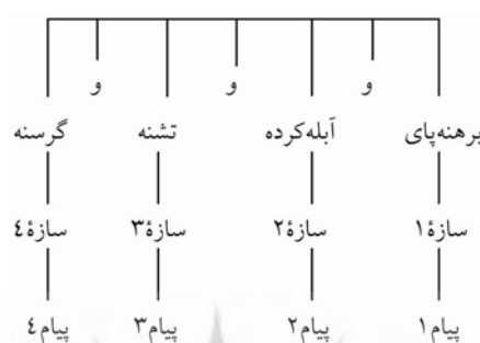
نمودار ۱. نمودار درختی ساخت هم‌پایه

- چون نزدیک عرفات رسیدند درویشی همی آمد، «برهنه‌پای و آبله‌کرده و تشنه و گرسنه» (عنصرالمعالی، ۱۳۶۴: ۲۱).