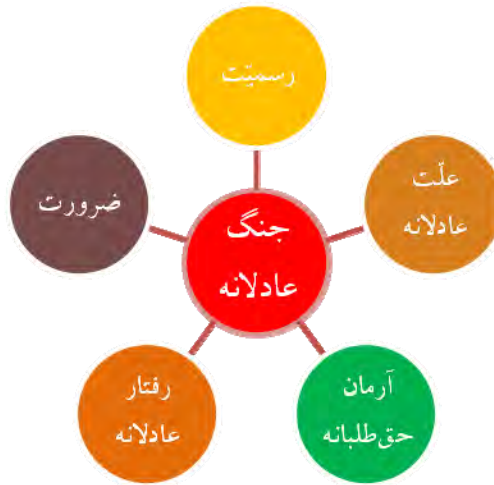
شکل ۲. شاخص‌های جنگ عادلانه

شاخص رسمیت به این مسئله می‌پردازد که مرجع مشروع اعلان جنگ، چه کسی یا چه نهادی است. در مسئله جنگ، جان و مال افراد جامعه در معرض خطر قرار می‌گیرد و بدین جهت تنها شخص یا نهادی، مشروعیت اعلان جنگ را دارد که با پشتوانه مردم به حکومت رسیده باشد. حاکم جامعه این صلاحیت را دارد که تحت شرایطی، این اختیار را به نماینده خویش واگذار کند از این‌رو نخبگان جامعه که متولی امر حکومت نیستند، بدون اذن حاکم چنین صلاحیتی ندارد.