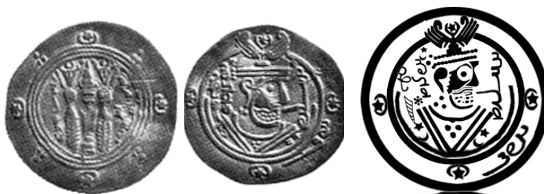
تصویر ۵. طرح و سکه خالد بن برمک، بانک سپه، ۱۶۱۲