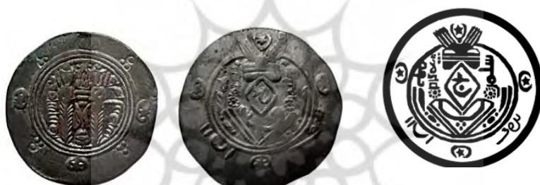
تصویر ۹. طرح و سکه سلیمان (موزه پول بنیاد، ۴۳۲۱۱-م)

در میان سکه‌های ولات عباسی سکه‌های سلیمان (حک. ۱۳۶-۱۳۸ پی. ۷۸۸-۷۹۰ م.) شکل متمایزی دارد و به جای چهره پادشاه، لوزی با سورشارژ بیخ خ به کوفی آمده است (تصویر ۹). این شکل سکه شاید تغییری بوده که سلیمان ضروری می‌دانسته تا بدین وسیله وجدان دینی خود را به عنوان یک مسلمان راضی نگه دارد، ۱ تغییری که احتمالاً به دلیل تمایل به مبارزه با بت پرستی بوده و بر اساس آن به‌کارگیری عکس را منع کرده است. ۲ سکه سلیمان گرچه چهره پادشاه را مخدوش کرده، ولی نمادهای مرتبط با زرتشت چون بال‌های گشوده، هلال ماه و ستاره، خط پهلوی و کتیبه‌های مذهبی، گردنبند و گوشواره، آتشدان و نگهبانان برسم به دست و سه نقطه نمادین را بر خود دارد.