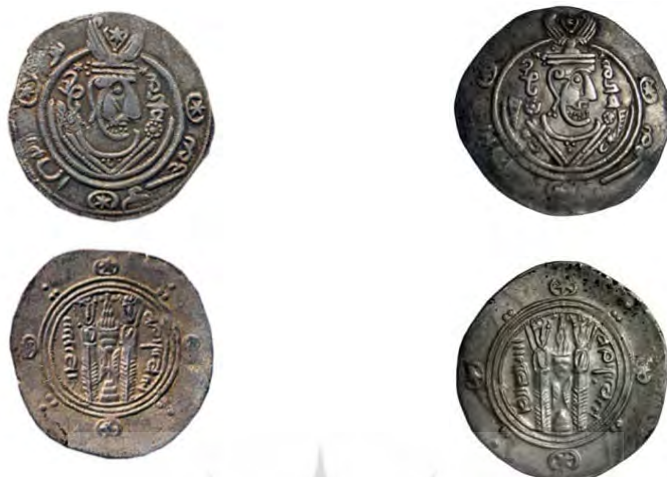
۱. سکه بی‌نام، آستان قدس، س ۴۴۲۹ ۲. سکه بی‌نام، موزه پول بنیاد، ۴۹۳۴۷-م