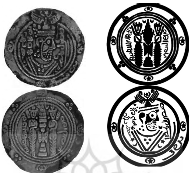
تصویر ۲. طرح و تصویر سکه دات برزمهر، موزه بانک سپه، ۱۱۲۵۵

| بررسی اوضاع اجتماعی و فرهنگی اسپهبدان دابویی و ولات عباسی؛ با تکیه بر سکه‌ها | ۱۴۳