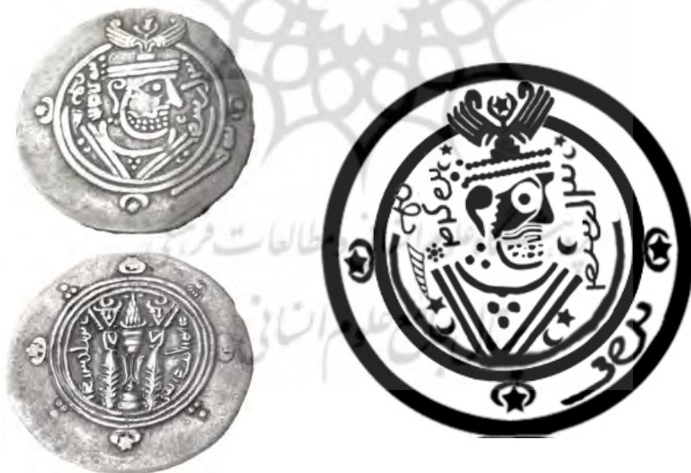
تصویر ۳. طرح و تصویر سکه خورشید، موزه بابل، ۶۴۲