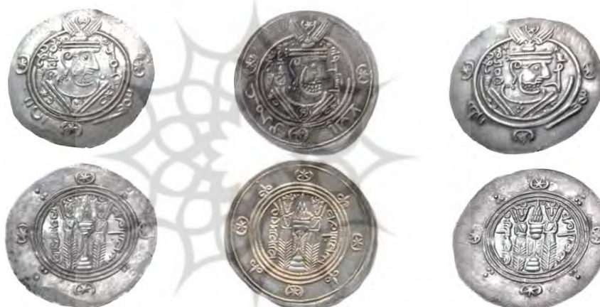
۱. موزه ملک، ۲۰۸۸ ۲. موزه پول بنیاد، ۳۴۹۶۹-م ۳. آستان قدس، ۷۶۰۲ ر ۲ تصویر ۶. سکه‌های عمر بن العلاء

سعید بن دعلج (حک. ۱۲۵-۱۲۷ پی. / ۷۷۷-۷۷۹ م.) و یحیی بن مخنق (حک. ۱۲۸-۱۳۰ پی. / ۷۸۰-۷۸۲ م.) و یحیی بن الحرشی (حک. ۱۳۱ پی. / ۷۸۳ م.) سکه‌های سبک اسپهبدی دارند (تصویر ۷). نام امیر (سعید، یحیی و الحرشی) یا نسب او (سعید بن دعلج) نگاشته شده و بر اولین و چهارمین قطعه حاشیه‌ی روی سکه‌ی یحیی موتیف گل زنبق نقش شده که پیش‌تر بر سکه‌های عمر به تاریخ ۱۲۵ پی. (۷۷۷ م.) دیده شده است. ۱ تقارن