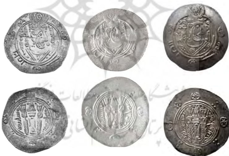
۳. معد، بانک سپه، ۱۰۶۷۷ ۴. مقاتل، آستان قدس، س ۴۲۲۹ ۵. قُدید، Malek, 2004: 124, 137.2

تصویر ۸. سکه‌های مهران، جریر، معد، مقاتل و قدید