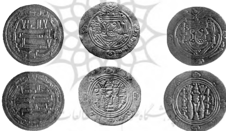
۱. بانک سپه، ۱۵۸۴. ۲. Malek, 2004: 17, 54.3. ۳. Malek, 2004: 17, 54b.1.