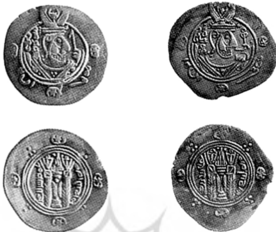
۱. مهران، موزه سمنان، Eb10 ۲. جریر، موزه بانک سپه، ۱۱۳۸۵