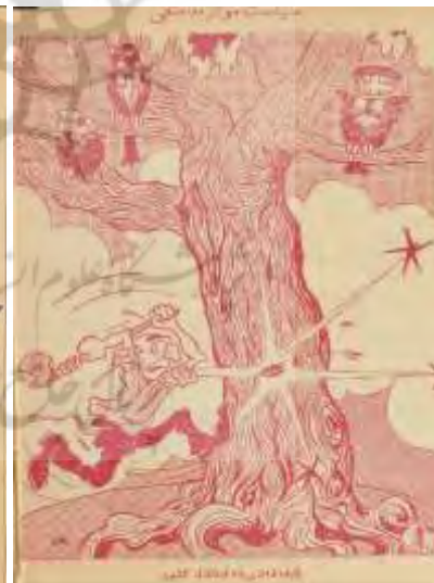
شکل ۱۲- مردم، ۱۹ دی ۱۳۲۴- ش ۱۴