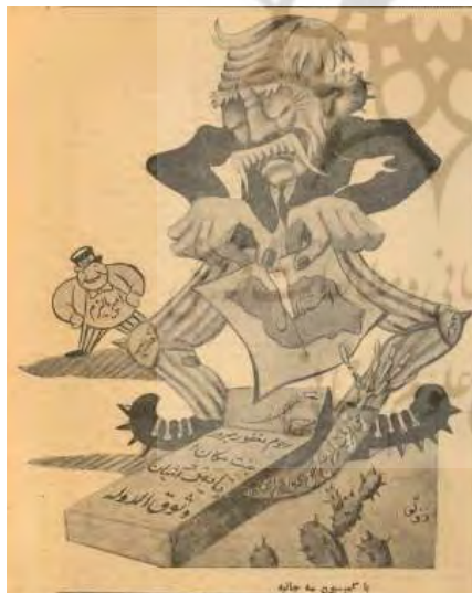
شکل ۱۳- تهران مصور، ۶ مهر ۱۳۲۴، ش ۱۲۴