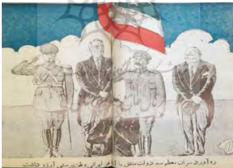
شکل ۹- تهران مصور، ۱۸ آذر ۱۳۲۲، ش ۳۷