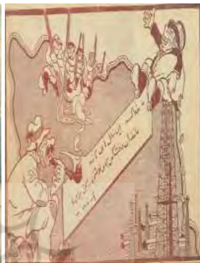
شکل ۲۶- تهران مصور، ۲۹ شهریور ۱۳۲۵، ش ۱۷۰ شکل ۲۷- تهران مصور، ۲۳ فروردین ۱۳۲۵، ش ۱۴۸