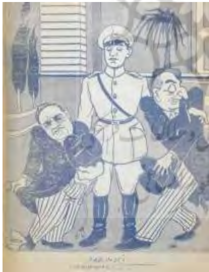
شکل ۲۵- تهران مصور، ۳ خرداد ۱۳۲۵، ش ۱۵۴