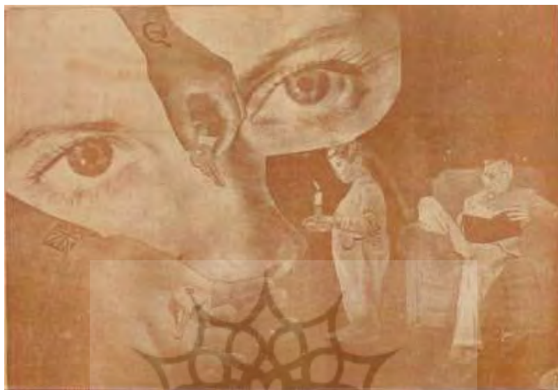
شکل ۱۷- تهران مصور، ۵ بهمن ۱۳۲۴، ش ۱۴۰