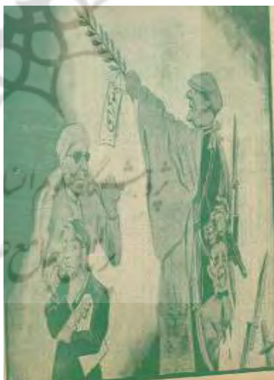
شکل ۵- مردم، ۱۷ دی ۱۳۲۴، ش ۱۲