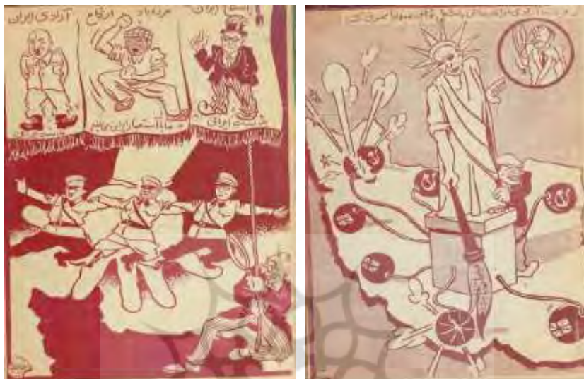
شکل ۷- تهران مصور، ۲۸ تیر ۱۳۲۵، ش ۱۶۲ شکل ۸- تهران مصور، ۱۹ مهر ۱۳۲۵، ش ۱۷۳