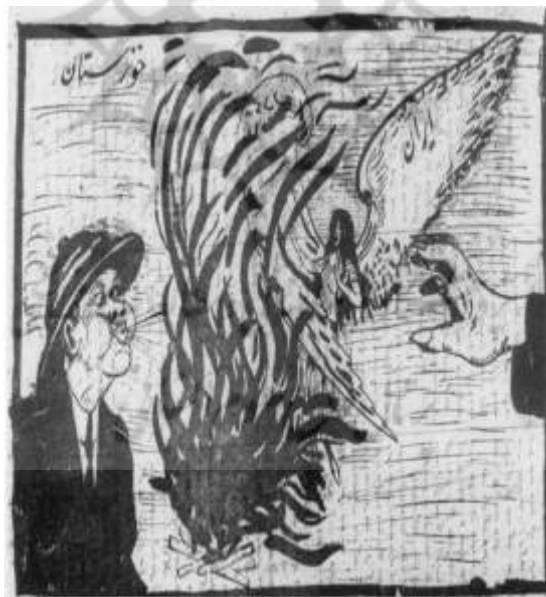
شکل ۳۱- ناهید، ۲۸ اسد ۱۳۰۳، ش ۲۵