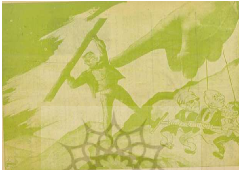
شکل ۱۴- تهران مصور، ۲۸ دی ۱۳۲۴، ش ۱۳۹