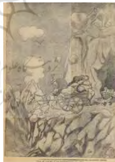
شکل ۲- تهران مصور، ۲ شهریور ۱۳۲۴، ش ۱۲۰