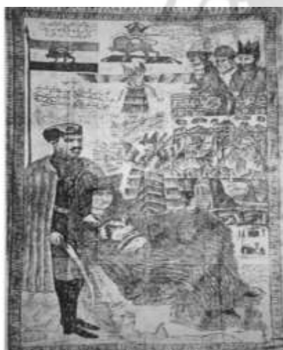
شکل ۲۲- هراز، ۱۵ تیر ۱۳۲۴، ش ۱۸