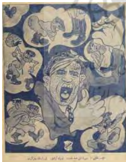
شکل ۳- تهران مصور، ۳۰ شهریور ۱۳۲۴، ش ۱۲۳