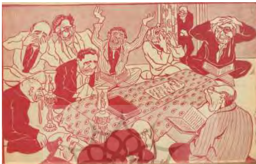
شکل ۴- تهران مصور، ۲۷ مهر ۱۳۲۴، ش ۱۲۷