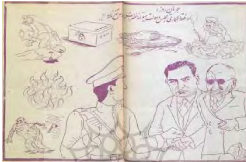
شکل ۲۳- تهران مصور، ۲۴ تیر ۱۳۲۲، ش ۱۸