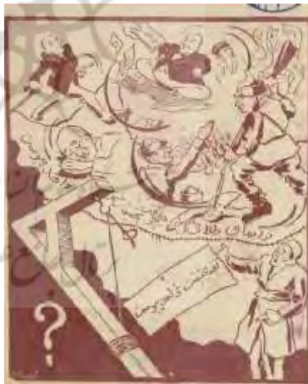
شکل ۲۴- تهران مصور، ۱۵ تیر ۱۳۲۴، ش ۱۱۳