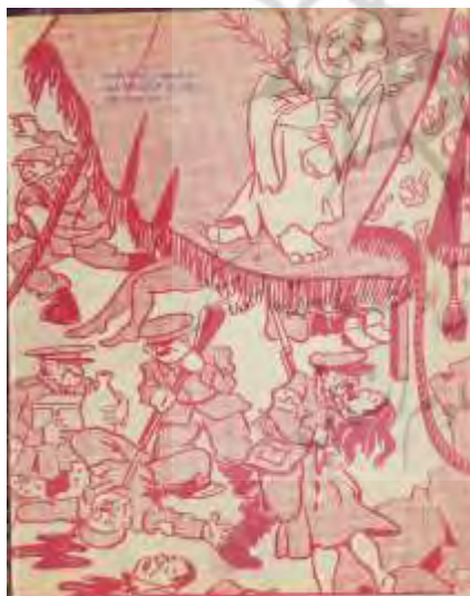
شکل ۱۹- تهران مصور، ۱۵ آذر ۱۳۲۵، ش ۱۸۰