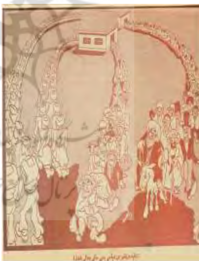
شکل ۲۸- تهران مصور، ۱۷ اسفند ۱۳۲۴، ش ۱۴۶ شکل ۲۹- تهران مصور، ۵ مهر ۱۳۲۵، ش ۱۷۱