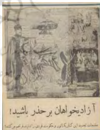
شکل ۲۱- بررسی های تاریخی، اسفند ۱۳۵۵، ش ۶۷، ۳۴۳