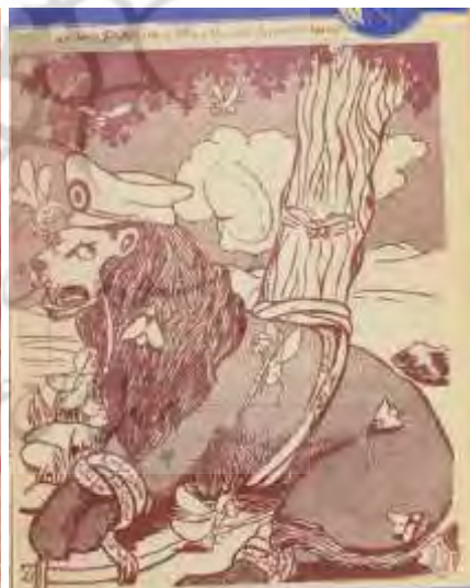
شکل ۱۸- تهران مصور، ۱۷ خرداد ۱۳۲۵، ش ۱۵۶