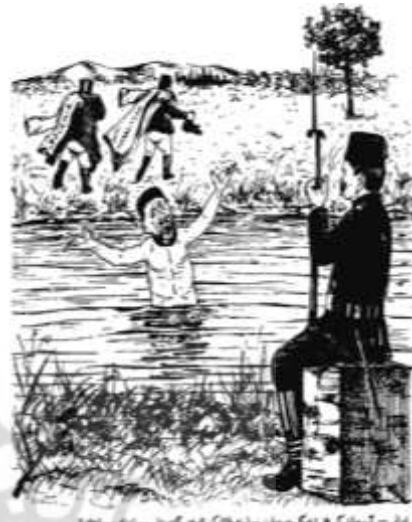
شکل ۱۰- Brummett, Palmira, 2000, P108