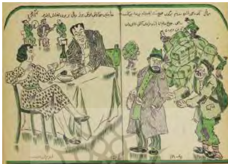
شکل ۱- آذربایجان، ۲۴ آذر ۱۳۲۰، ش ۱۳