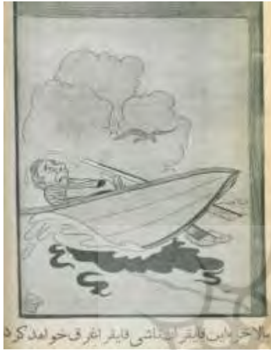
شکل ۱۱- تهران مصور، ۲۸ مهر ۱۳۲۳، ش ۷۸