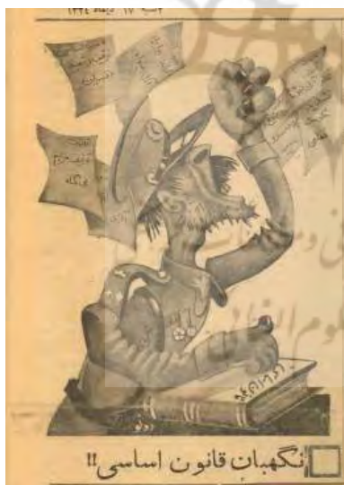
شکل ۶- تهران مصور، ۱۴ دی ۱۳۲۴، ش ۱۳۷