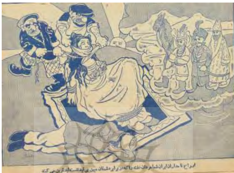
شکل ۲۰- تهران مصور، ۲۳ آذر ۱۳۲۴، ش ۱۳۵