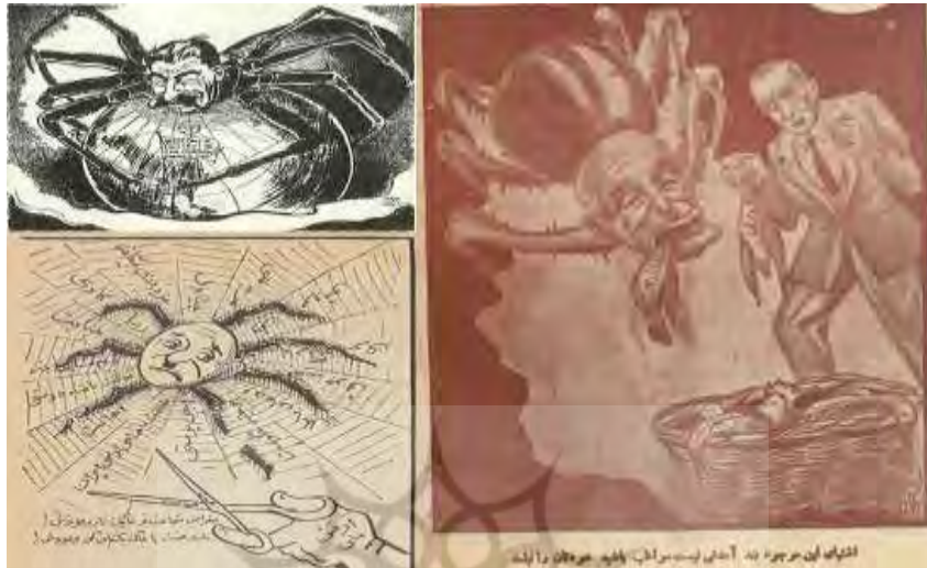
شکل ۳۰- تهران مصور، ۲۰ اردیبهشت ۱۳۲۵، ش ۱۵۲ و ۲۲ آذر ۱۳۲۵، ش ۱۸۲