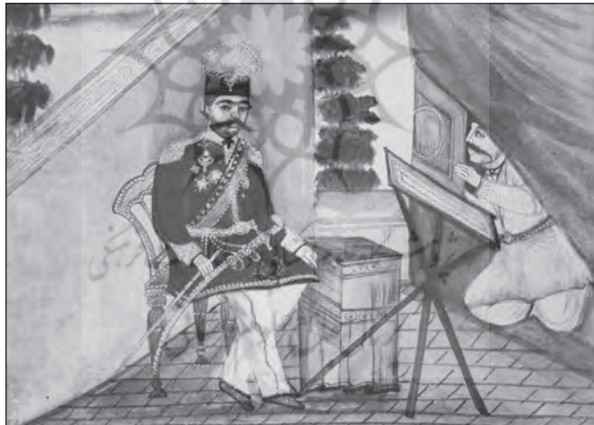
تصویر ۴. ناصرالدین شاه نشسته در مقابل «ماشین عکس‌اندازی»، ۹۶ از نقاشی ناشناس، حدود ۱۲۸۰ق. ۹۷ این تصویر را ممکن است همچون اشاره‌ای به آن وضعیت تاریخی ویژه در عهد ناصری در نظر گرفت که صورت‌های روزنامه را با قابلیت‌شان در باز نمود و انعکاس شباهت، به ابزاری در چهره‌یابی دولت بدل ساخت: قرارگیری شاه «طالب عکس»، مقابل نیروی برخاسته از یک دستگاه بازنمایی واقع‌نما.