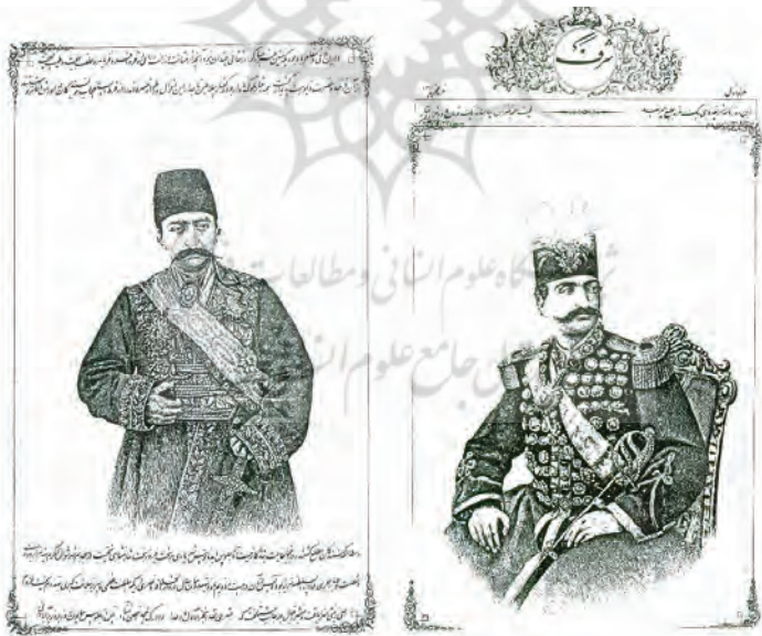
تصویر ۲. دو نمونه از پرتره‌های چاپ سنگی در روزنامه شرف. ۹۴