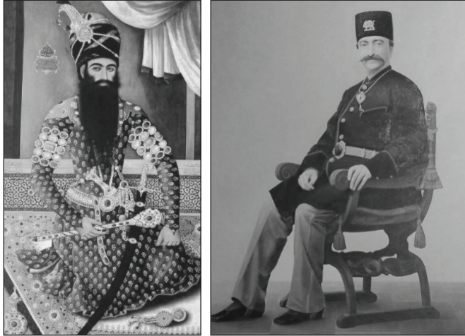
تصویر ۳. دو نقاشی از شاه ایران به فاصله تقریباً یک قرن که از چرخشی اساسی در شیوه بیان بصری قدرت نشان دارند. چپ: پرتره فتحعلی شاه اثر میرزابابا ۱۲۱۳ق؛ راست: پرتره ناصرالدین شاه اثر کمال‌الملک ۱۳۰۷ق. ۹۵