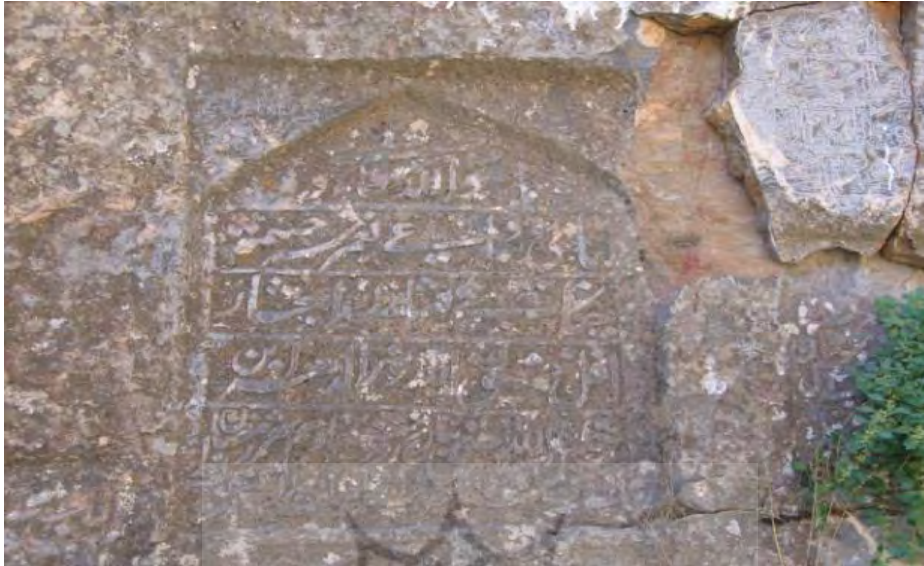
تصویر شماره چهار: کتیبه مربوط به نورالدهر و اشاره به ایجاد چشمه و درختکاری در چکاب

«هو الله سبحانه تعالی، بانی و ساعی تعمیر سرچشمه چکاب و نشاندن اشجار، اقل خلق الله، نور الدهر بن خلیل الله الحسینی به تاریخ روز شنبه یازدهم شهر رمضان المبارک ۱۱۰۳ق صورت اتمام یافت.»