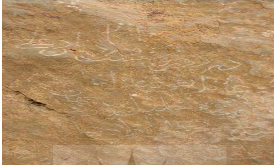
تصویر شماره یک: سنگ‌نوشته مربوط به شاه خلیل‌الله اول در انجدان

جانشین امام خلیل‌الله اول نیز نام صوفیانه نورالدهر (شاه نورالدین) علی داشت. این امام را که سی‌وهشتمین امام در سلسله امامان محسوب می‌شود، می‌توان با نورالدهر (بن) خلیل‌الله که در رجب ۱۰۸۲ ق در گذشته، یکی دانست. ۱ خلیل‌الله اول و نورالدهر، در انجدان دفن شده‌اند. ۲