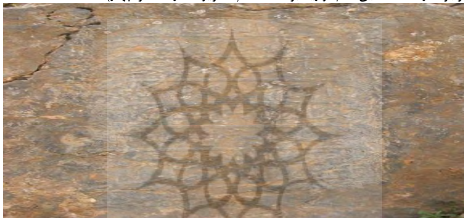
تصویر شماره سه: کتیبه ایجاد چشمه توسط نورالدهر در قتلو «بانی و ساعی چشمه مبارک‌آباد... این بنده درگاه نورالدهر الحسینی...»

پیرامون آن تلاش نمودند و این امر را با ایجاد و توسعه برخی آرامگاه‌ها، مساجد، قلعه‌ها، چشمه‌ها و... اجرایی کردند. در برخی از سنگ‌نوشته‌ها و کتیبه‌های دره چکاب و قتلو، در پیرامون انجدان، از فعالیت امامان فرقه نزاری برای ایجاد چشمه‌ها و درختکاری صحبت به میان آمده است. مشخصاً نورالدهر، فرزند خلیل‌الله انجدانی و سی‌وهشتمین امام نزاری انجدان، بر اساس دو کتیبه موجود در جهت ایجاد چشمه‌های چکاب و مبارک‌آباد که امروزه به قتلو نامبردار شده، کوشیده است. درختکاری دره چکاب نیز بر اساس سنگ‌نوشته موجود، از اقدامات این امام نزاریه بوده است. ۱ (تصاویر شماره سه و چهار)