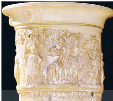
تصویر ۳: صحنه داستانی بر ریتون عاجی نسا. ۲