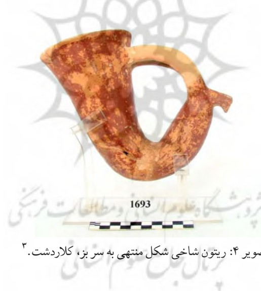
تصویر ۴: ریتون شاخی شکل منتهی به سر بز، کلاردشت. ۳