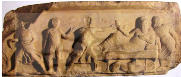
تصویر ۱: بُرکردن جام از مایع درون ریتون؛ سده چهارم ق.م. ۱