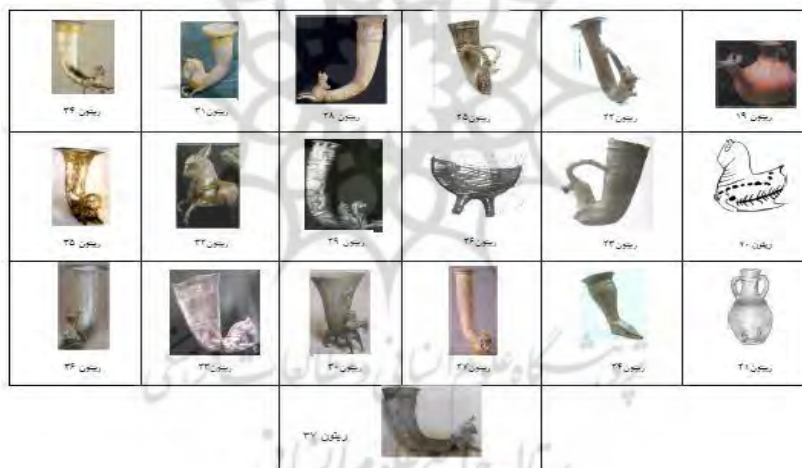
کاتالوگ شماره ۲: ریتون‌های اشکانی.