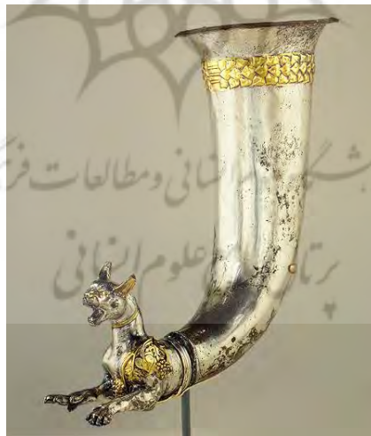
تصویر ۲: ریتون اشکانی مربوط به قرن اول میلادی. ۱