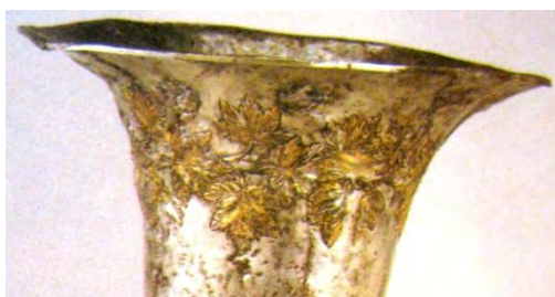
تصویر ۵: شاخ و برگ انگور روی لبه جام ریتون. ۱