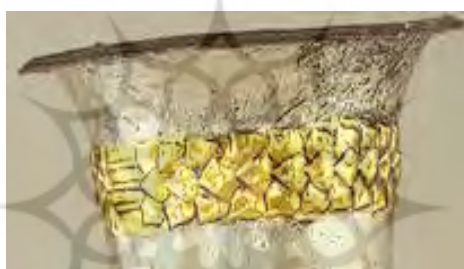
تصویر ۶: برگ‌های کنگر روی لبه جام. ۲

پژوهشگاه علوم انسانی و مطالعات فرهنگی پرتال جامع علوم انسانی