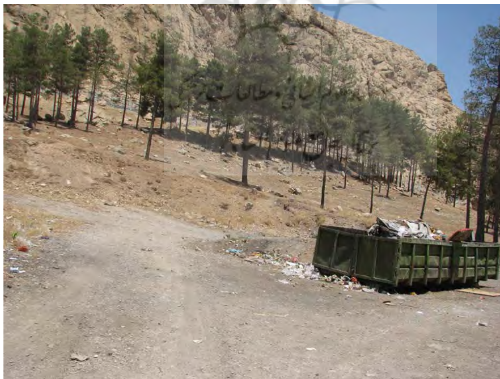
تصویر ۶. انباشت زباله در محوطه.

همان‌طور که انتظار می‌رود، سفال به‌عنوان مهم‌ترین و البته فراوان‌ترین یافته فرهنگی در خاور نزدیک شناخته می‌شود. مواد فرهنگی سطحی این محوطه را نیز به دلیل فرسایش و تخریب، فقط قطعات سفالی تشکیل می‌دهد. سفال‌های دوره مس و سنگ جدید در محوطه پارک غربی تاق‌بستان دارای خمیره نخودی با آمیزه گیاهی و دارای پوششی به‌رنگ قرمز روشن هستند. این