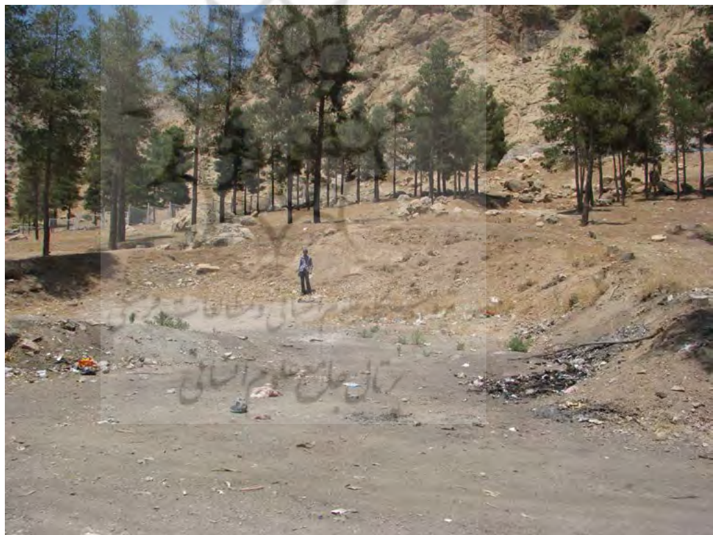
تصویر ۵. تخریب انجام شده توسط ماشین‌آلات راه‌سازی.