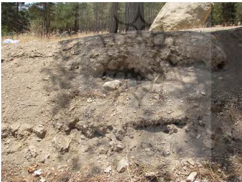
تصویر ۸. بخشی از محوطه که توسط تیغه‌های بولدوزر برش داده شده است.

دوره، شاهد کاهش بی‌سابقه استقرارها در زاگرس مرکزی هستیم. از آنجایی که کاهش جمعیت نمی‌تواند دلیلی واقعی برای چنین رویدادی باشد، به نظر می‌رسد تغییر الگوهای معیشتی از یکجانشینی و کشاورزی به کوچ‌روی، دلیلی برای این مدعاست (Rothman & Badler, 2011). محوطه پارک غربی تاق‌بستان نیز محوطه‌ای به‌جامانده از دوره مس‌وسنگ جدید بوده که در حاشیه دشت کرمانشاه واقع شده است. این محوطه همزمان با تحولات فرهنگی در حال جریان در سرزمین‌های پست میان‌رودان، دارای ساکنینی بوده و در فاصله یک کیلومتری منابع دائمی آب و در حاشیه دشت قرار گرفته است. هرچند براساس نظر برخی از پژوهشگران پیرامون استقرارهای