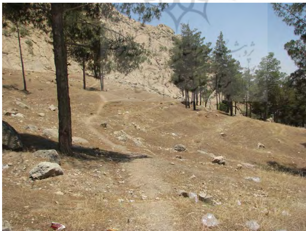
تصویر ۳. قرارگیری محوطه در میان انبوه درختان کاج.