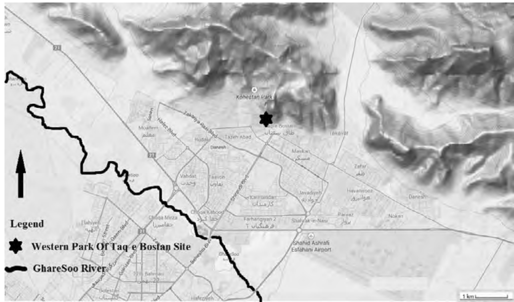
تصویر ۴. موقعیت قرارگیری محوطه در شمال رودخانه قره‌سو.