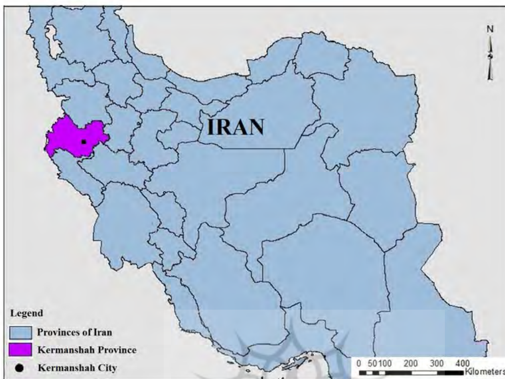
تصویر ۲. موقعیت قرارگیری شهر کرمانشاه (After modified Mirghaderi 2013. Fig 1).