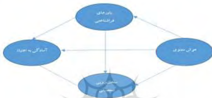
شکل ۱. مدل مفهومی ارتباط هوش معنوی با آمادگی به اعتیاد با میانجی‌گری باورهای فراشناختی و سخت‌رویی تحصیلی

انجام شده و به دنبال پاسخ به این سوال است که آیا هوش معنوی با میانجی‌گری باورهای فراشناختی و سخت‌رویی تحصیلی می‌تواند آمادگی به اعتیاد را در دانشجویان پیش‌بینی نماید؟ بررسی متغیرهای مذکور در این تحقیق به صورت مدل علی و اثرگذاری هر کدام در مدل پیشنهادی مطابق شکل (۱) می‌تواند به ایجاد دانش جدید در این حوزه کمک کند.