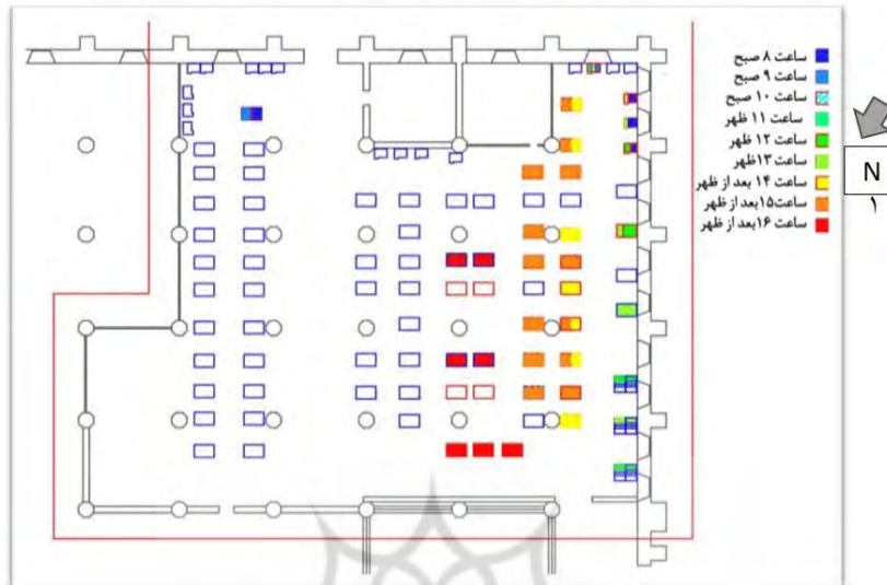
شکل (۱): پلان کتابخانه ملی مرکزی کرمان (سالن مطالعه پسران)

ساختمان مورد نظر به سمت شمال غربی آن است (شاطریان، ۱۳۸۸، ۲۳۷). با توجه به اینکه در این کتابخانه فقط در سالن مطالعه پسران پنجره وجود داشت همین محدوده مورد بررسی قرار گرفت. کتابخانه مورد نظر در تمامی جهات اصلی دارای پنجره هایی با ارتفاع ۲،۲۰ متر و عرض ۱،۲۰ متر با آکابه هایی به ارتفاع ۰،۹۵ متر می باشد، ارتفاع میزها و صندلی های مطالعه استاندارد بوده است. کارت مشاهده (عکس ۱) این پژوهش در اواسط آبان ماه بین ساعت ۸ صبح تا ۴ بعد از ظهر در سالن مطالعه پسران برداشت شده است و سپس، میزهایی را که در طول ساعات ذکر شده تابش خورشید روی سطح آنها می تابید برای این پژوهش در نظر گرفته شد و برای اندازه گیری شدت روشنایی سطح میزهای انتخابی از دستگاه سنجش روشنایی (لوکس متر) مدل Hagner EC1 استفاده شد، شدت روشنایی نور خورشید بین ۸۵۰ تا ۸۹۹۰ لوکس متغییر روی سطح آنها می تابید و همچنین پرسشنامه ها از اواسط آبان ۱۳۹۶ تا اواخر دی ۱۳۹۶ در بازه زمانی معین به افرادی داده شد که این میزها را برای مطالعه انتخاب می کردند.