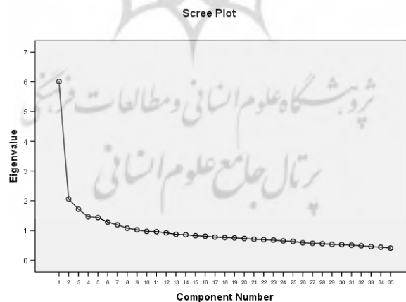
نمودار ۱. شماره عامل‌ها و مقادیر مشخصه

نتایج جدول ۳ نشان می‌دهد مدل ۹ عاملی فوق ۴۹/۳۶ درصد واریانس را در نمرات پرسشنامه غربالگری اختلالات هیجانی مرتبط با اضطراب کودک (فرم ۴۱ سؤالی) تبیین می‌کند. نمودار اسکری ۱ شماره عوامل و مقدار مشخصه آنها را نشان می‌دهد. همانگونه که در جدول مشخص است سؤال ۲۱ بر روی هیچکدام از ابعاد بدست آمده بار عاملی ندارد و بنابراین حذف می‌گردد.