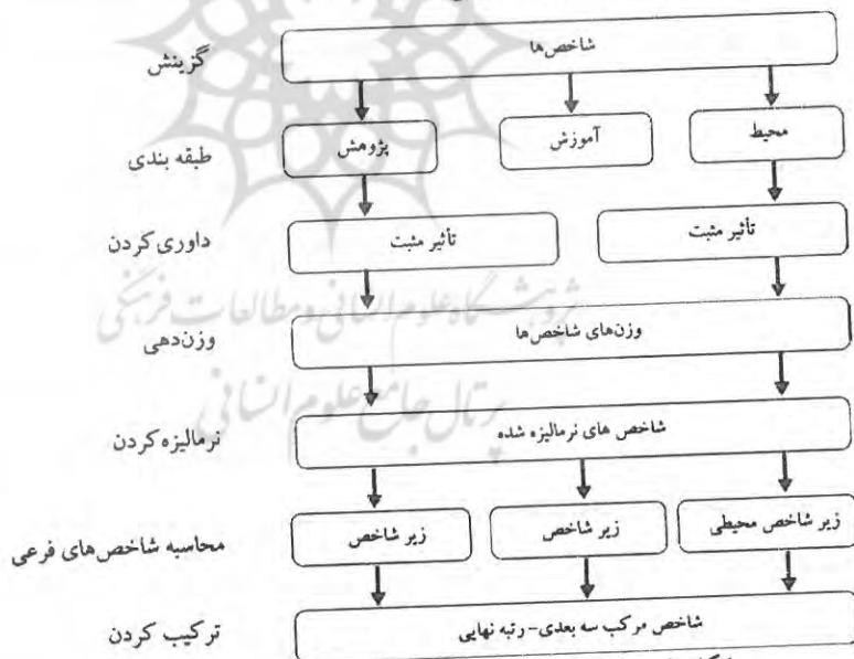
شکل ۱. مدل تحلیل داده‌ها برای تعیین رتبه نهایی دانشگاه‌ها

مدل تحلیل داده‌ها در شکل ۱ گزارش شده است. بر پایه این مدل، نخست شاخص‌ها در سه بعد آموزشی، پژوهشی و محیطی و سپس نشانگرهای هر بعد وزن داده شدند. پس از نرمالیزه شدن، وزن‌ها با یکدیگر ترکیب شدند. محاسبات مربوط به استخراج وزن‌های نهایی با نرم‌افزار EXPERT CHOICE 11 انجام شده است. الگوریتم نرم‌افزار برای استخراج وزن‌ها بر پایه روش تحلیل سلسله مراتبی است. در این روش وزن‌ها با روش سلسله مراتبی استخراج و ترکیب شده‌اند. مدل سلسله مراتبی شاخص‌ها در شکل ۲ گزارش شده است. رتبه نهایی (A) با توجه به وزن شاخص‌ها در بعد B و وزن نشانگرها در هر بعد تعیین شده است. نشانگرها در سه بعد تدوین شده‌اند.