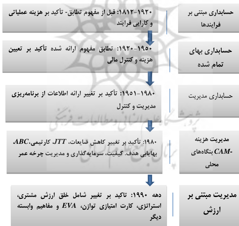
چارت ۱ - تکامل روش حسابداری مدیریت (کمال، ۲۰۱۵)