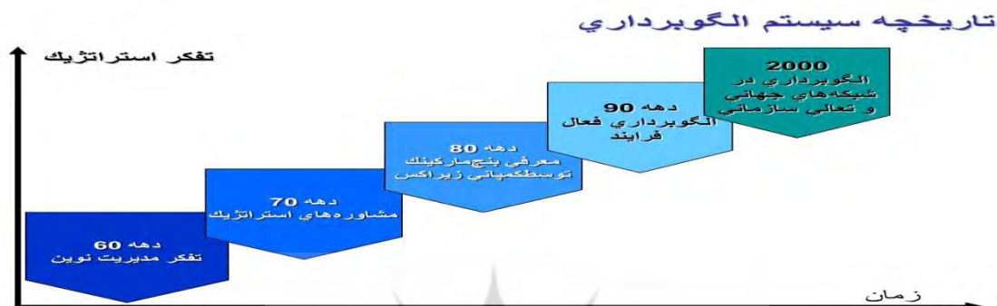
شکل ۳ - تاریخچه سیستم الگوبرداری

می‌کنند، بسیار مهم و مورد توجه است. اگر احساس شود که رقابت بیشتری وجود دارد، آن‌گاه عمده توجه‌ها به بازارها و مشتریان خواهد بود. تغییر اولیه، پیشرفت در فن‌آوری اطلاعات است که در سال‌های اخیر صورت گرفته است. شتاب تغییر فن‌آوری طی مدت ۳۰ سال گذشته تأثیر شدیدی بر حیات سازمانی داشته است. افزایش استفاده از رایانه، تأثیر عمده‌ای بر ماهیت کار، به‌ویژه کارهای منشی‌گری و جریان اطلاعات در سازمان داشته است. به‌علاوه تغییرات عمده دیگری نیز در ساختار سازمانی وجود داشته است. برای مثال، در حالی که در دهه ۱۹۷۰ میلادی در آمریکا، موج استحصال و ادغام زیادی با ایجاد شرکت‌های جمعی وجود داشت، اما در دهه ۱۹۹۰، سازمان‌ها تغییر مسیر دادند؛ این تغییرات مختلف در رقابت، فن‌آوری و ساختار سازمانی، همگی دارای تلویحات مهمی برای ماهیت حسابداری مدیریت بوده‌اند؛ به‌ویژه در روشی که امروزه تکنیک‌های حسابداری متعارف استفاده می‌شوند (کمال، ۲۰۱۵)