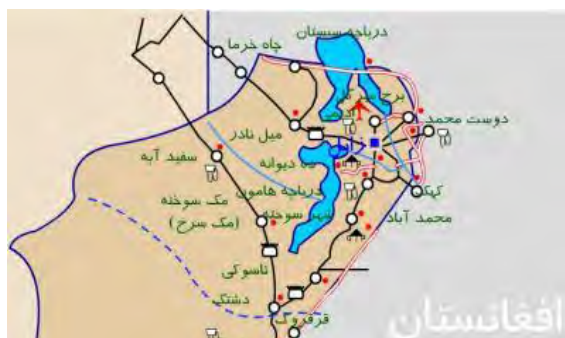
شکل شماره (۱). نقشه جغرافیایی زابل

متغیرهای مورد استفاده در این مقاله به شرح زیر است: