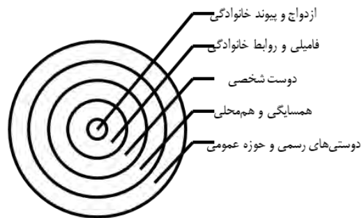
شکل شماره (۱). مرزبندی و تردهای فرهنگی در سطوح مختلف

بنابراین، می‌توان نتیجه گرفت که مرزهای فرهنگی در سطح ازدواج، روابط خانوادگی، و دوستی میان دو طرف طیف (متشرع و غیرمتشرع) شدید است، اما در سطح دوستی، از شدت این مرزبندی برای کسانی که در میانه طیف قرار دارند، کاسته می‌شود و امکان تردد فرهنگی، افزایش می‌یابد. این تردد در حوزه عمومی و رسمی، بیشتر مشهود است.