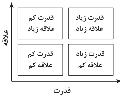
شکل ۳: ماتریس ۲×۲ قدرت در برابر علائق (ادن و آکرمن، ۲۰۱۱)

۳. توسعه راهبردهای مدیریت ذی‌نفعان، تشخیص زمان و روش مناسب برای تغییر یا ارتقای اهمیت نقش هر یک از ذی‌نفعان. این موضوع خود مستلزم تعریف دقیق قدرت و چگونگی تأثیرگذاری آنها بر مسیر حرکت سازمان است. (ادن و آکرمن، ۲۰۱۱) مقاله حاضر دنبال روشی است که شدت یا ضعف روابط بین نهادهای نظام نوآوری صنایع فرهنگی را بررسی نماید تا مشخص شود که کدام نهادها از تأثیر و گرایش بیشتری بر سایر نهادها (و کلیت نظام نوآوری صنایع فرهنگی) برخوردارند. بنابراین برای تحلیل ذی‌نفعان از ماتریس «قدرت علائق» استفاده شده است که در سال ۱۹۹۸ توسط ادن و اکرمین طراحی شد. ابعاد این ماتریس ۲×۲ عبارت‌اند از میزان گرایش ذی‌نفع به سازمان، نظام یا صنعت مورد بحث و قدرت یا تأثیر ذی‌نفع برای اثرگذاری در سازمان، نظام یا صنعت مورد بحث.