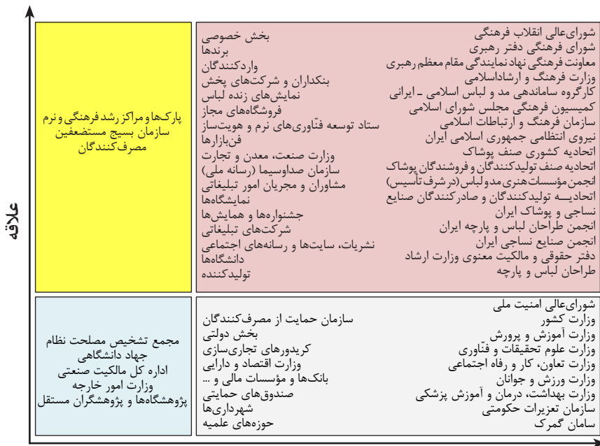
شکل ۸: ماتریس ۲×۲ قدرت در برابر علائق ذی‌نفعان صنعت اسباب‌بازی