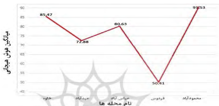
نمودار ۲- میانگین هوش هیجانی در محله‌ها

همان طور که مشاهده می‌شود، مقدار P-Value از ۰/۰۵ کمتر است؛ بنابراین، می‌توان نتیجه گرفت که میان سرمایه اجتماعی در محله‌های شهر فردوسیبه تفاوت معناداری وجود دارد و دریافت که بالاترین میانگین سرمایه اجتماعی به محله فردوس و پایین‌ترین میانگین، به محله محمودآباد مربوط می‌شود.