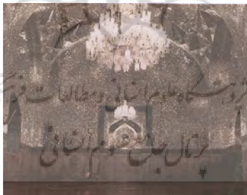
تصویر ۸. کتیبه‌های دور محراب رواق دارالسلام