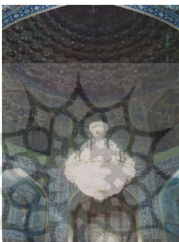
تصویر ۵. تزیینات کتیبه‌ای اطراف رواق گنبد الله وردی خان

از بالای سمت راست تا سقف و از آنجا به سمت پایین تا بالای ازاره سمت چپ، بر کتیبه کاشی معرق به خط ثلث آیه‌های اول تا پنجم سوره مبارکه ملک از «تَبَارَكَ الَّذِي تَأْذَابُ السَّعِيرِ» با مضمون توانایی خداوند، آمرزنده گناهان، بخشنده نظم در خلقت خداوند است نگاشته شده است. تاریخ اتمام کاشی کاری آن در پایه شمالی سردر با کاشی ممتاز و معرق سال ۱۰۲۲ ش/۱۶۱۳ م نوشته شده است (کاویانان، ۱۳۵۴: ۱۵۲) (تصویر ۵).