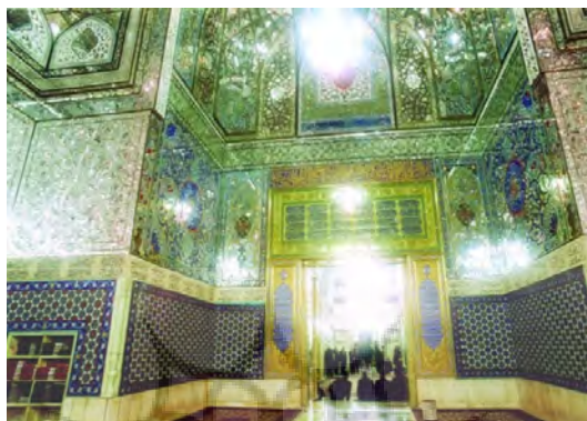
تصویر ۷. اشعار فارسی در بالای ازاره‌های اطراف رواق دارالسیاده

❖ و در اینجا به اختصار به آنها اشاره می‌شود. بالای قسمتی از ازاره شرقی دارالسیاده که به دارالحفاظ می‌رود قصیده‌ای از اشعار سرخوش به سال ۱۲۷۱ق/۱۸۵۴ م به خط نستعلیق کتیبه شده است (تصویر ۷).