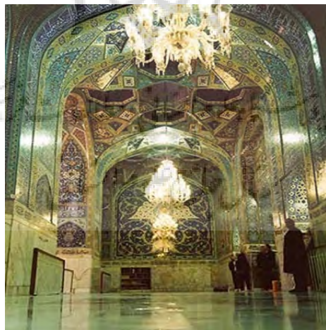
تصویر ۲. رواق دارالفیض، به سمت در ورودی به حرم مطهر

در حاشیه در ورودی به حرم مطهر، آیه هفتم سوره واقعه با مضمون نیکو حال بودن اصحاب یمین، در بالای طاق در کوچک به طرف حرم، آیه ۱۹۷ سوره بقره با مضمون برتری تقوا و خداترس بودن و در دیوار جنوبی این رواق، آیه ۲۸۵ سوره بقره با مضمون ایمان داشتن به خدا و پیامبر، در بدنه دیوار وسط طرف راست، آیه ۴۵ سوره حجر با مضمون پاداش اهل تقوی و در طرف چپ، آیه ۳۳ سوره ق با مضمون خاشع بودن در مقابل خداوند، مزین شده است (تصویر ۲).