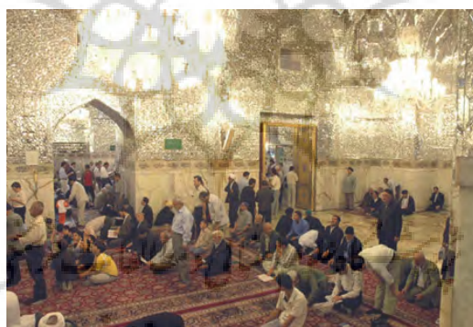
تصویر ۹. کتیبه‌های اشعار فارسی، بالای ازاره دور رواق دارالسلام

علاوه بر کتیبه قرآنی و دعایی رواق دارالسلام، در بالای ازاره در اطراف رواق، قصیده بسیار طولانی در ستایش امام رضا (ع) با خط نستعلیق روی سنگ حجاری شده است (تصویر ۹).