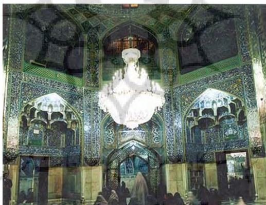
تصویر ۶. کتیبه‌های صفه‌های اطراف رواق الله وردی خان

«عَنِ الْإِمَامِ جَعْفَرِ الصَّادِقِ عَلَيْهِ السَّلَامُ قَالَ: يَقْتُلُ حَفْدَتِي بِأَرْضِ خُرَاسَانَ قَالَ فِي مَدِينَةِ بَقَالٍ لَهَا طُوسٌ، مَنْ زَارَهُ أَلِيهَا عَارِفًا بِحَقِّهِ أَخَذَتْهُ بِيَدِي يَوْمَ الْقِيَامَةِ وَأَدْخَلَتْهُ الْجَنَّةَ وَان كَانَ مِنْ أَهْلِ الْكِبَايِرِ» (عطاردی، ۱۳۷۱، ج ۱: ۱۹۶ - ۱۹۴). قَالَ سَلْتُ أَبَا جَعْفَرٍ مُحَمَّدَ الْجَوَادِ عَلَيْهِ السَّلَامُ مَا لِمَنْ زَارَ وَ الذِّكْرَ عَلَيْهِ السَّلَامُ بِه خُرَاسَانَ فَقَالَ الْجَنَّةَ وَ اللَّهُ الْجَنَّةَ وَ اللَّهُ. قَالَ: قُلْتُ جَعَلْتَ قَدَاكُ وَ مَا عَرَفَانِ حَقِّهِ؟ قَالَ تَعَلَّمْ أَنَّهُ إِمَامٌ مَعْتَرِضِ الطَّاعَةِ غَرِيبِ شَهِدٍ مِنْ زَرَاهِ عَارِفًا بِحَقِّهِ. اعْطَاءَ اللَّهُ عَزَّ وَجَلَّ اجْرَ سَبْعِينَ شَهِيدًا، مِمَّنْ ابْتِشَاهِدَ بَيْنَ يَدِي رَسُولِ اللَّهِ عَلَيْهِ وَ آلِهِ (تصویر ۶).