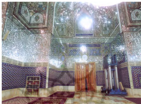
تصویر ۳. رواق دارالسیاده، جنب دارالحفاظ

❖ شکر کردن است و در قسمت دیگر، آیه ۲۸ سوره رعد با مضمون ایمان‌آوردندگان با ذکر خداوند آرامش می‌گیرند و یاد خدا آرامش‌بخش است. در دایره، سوره مبارکه قدر با مضمون توصیف عظمت شأن نزول قرآن در شب قدر است (تصویر ۳).