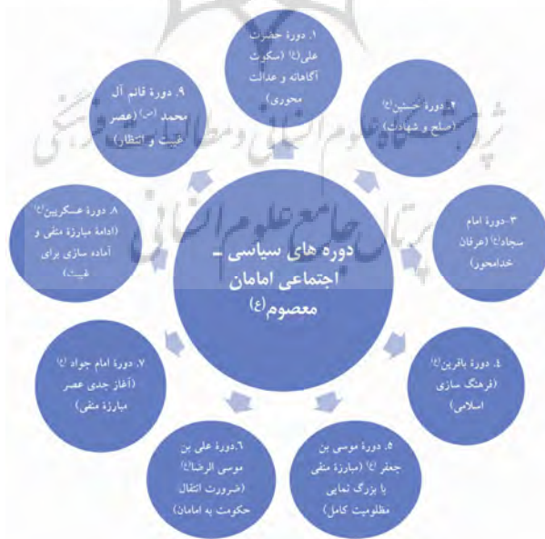
نمودار ۱. گفتمان امامان معصوم (ع) در دوره‌های مختلف سیاسی - اجتماعی

در تحقیقات صورت گرفته برای تقسیم‌بندی دوره‌های سیاسی - اجتماعی و گفتمان‌های امامان معصوم (ع) حاکم بر این دوره‌ها، ۹ دوره مورد شناسایی قرار گرفته‌اند (بشیر، ۱۳۹۱ - ب) که در نمودار شماره (۱) نشان داده شده‌اند.