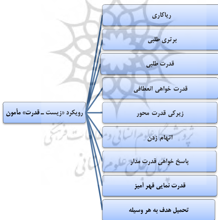
نمودار ۵. محورهای سلطه در رویکرد زیست - قدرت مأمون