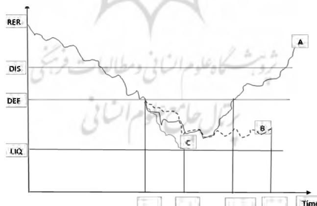
نمودار ۱: نمایش مسیرهای ممکن نرخ واقعی ارز ۲۱

اینها یعنی هنگامی که مسیر نرخ واقعی ارز در بالای سطح مرزهای DIS قرار دارد، اقتصاد در حالت قابل تحمل است. هنگامی که این مسیر مرزهای DIS را قطع می‌کند اما هنوز بالای مرزهای DEF است، اقتصاد در ناحیه پریشانی قرار دارد. هنگامی که این مسیر به مرزهای DEF برخورد می‌کند و بالای LIQ قرار می‌گیرد یعنی اقتصاد وارد منطقه نکول ۲۰ شده است. سه سناریو به صورت مسیرهای A, B, C نشان داده شده‌اند که می‌توانند هنگامی که نرخ واقعی ارز در این ناحیه می‌باشد، این مسیرها ممکن باشد.