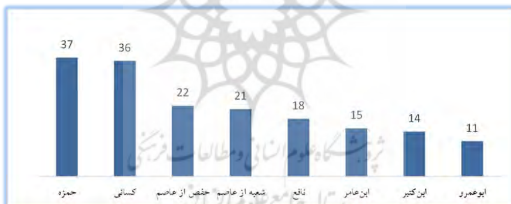
شکل ۲: نمودار تعداد تذکیر

چنان‌که جدول ۲ نشان می‌دهد، بیشترین تعداد تذکیر در قرائت حمزه و کسائی دیده می‌شود. این دو قرائت کوفی، به تأثیر پذیری از قرائت ابن مسعود شناخته‌اند. در رتبه بعد، روایت حفص و ابوبکر از قرائت عاصم قرار دارد. گرچه وجود نام عاصم در سند اخبار محل بحث، این آمار را تا اندازه‌ای توجیه می‌کند، اما نزدیکی آمار ابوبکر و حفص نشان می‌دهد که در این مورد، تفاوت چندانی بین این دو روایت وجود ندارد. این در حالی است که طبق سخن مشهوری از عاصم، وی قرائتی را به حفص آموخته است که از طریق عاصم به سلمی و از او به امام علی (ع) می‌رسد و روایت ابوبکر، چیزی است که او از زر بن حبیش و او از ابن مسعود آموخته است. (ذهبی، ۱۴۱۷ق، ج ۱، ص ۵۳) طبق این سخن، انتظار می‌رفت در روایت ابوبکر به تبع از قرائت ابن مسعود، موارد تذکیر بیشتری مشاهده شود، اما چنین نیست.