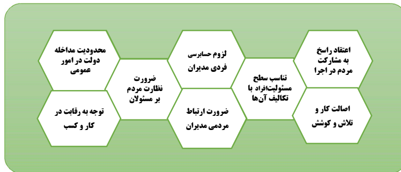
شکل ۳. نگرش‌ها و دیدگاه‌های کلان مدیریتی آیت‌الله مهدوی کنی (عجله)