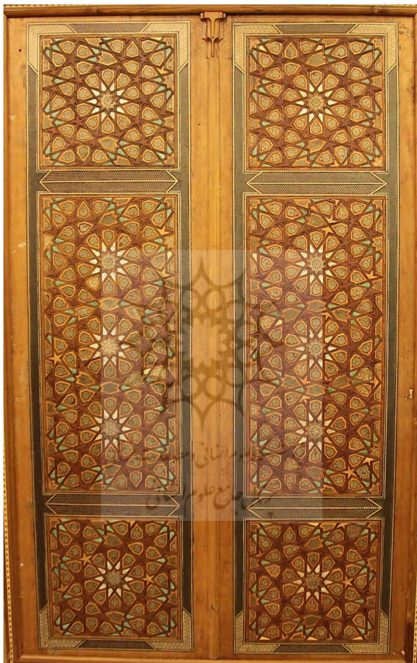
◀ تصویر ۱: درب خاتم کاری موجود در موزه حرم مطهر