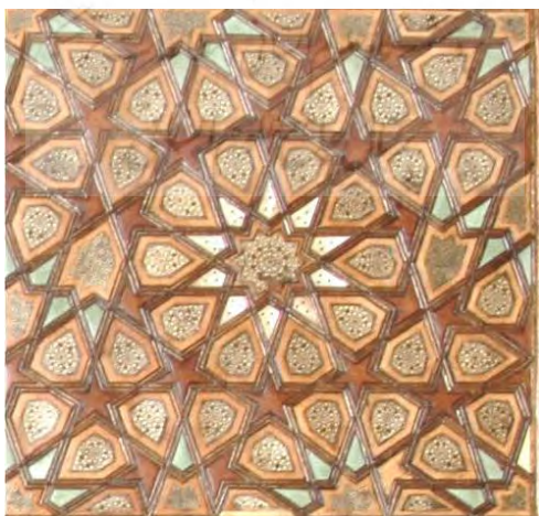
◀ تصویر ۳: استفاده از صدف در ستاره وسط طرح