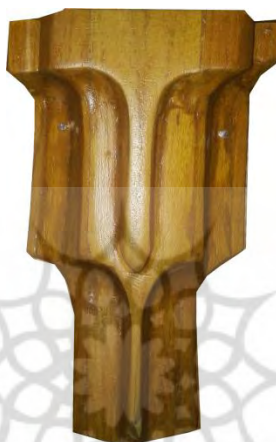
تصویر ۴: چوب وسط و بالایی درب

چوب وسط و بالایی این درب از قدمت بالا و شاید هم عصر با اولین خاتم کاری این درب باشد. مرمت‌های انجام شده چهار چوب درب را شامل می‌شود و در مواردی خاتم کاری دیده می‌شود. (تصویر ۴)