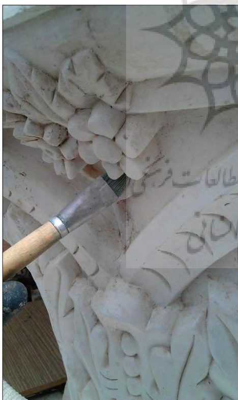
شکل ۲: انجام مراحل مرمت و بازسازی نمونه اصلی سرستون گچی انتخاب‌شده