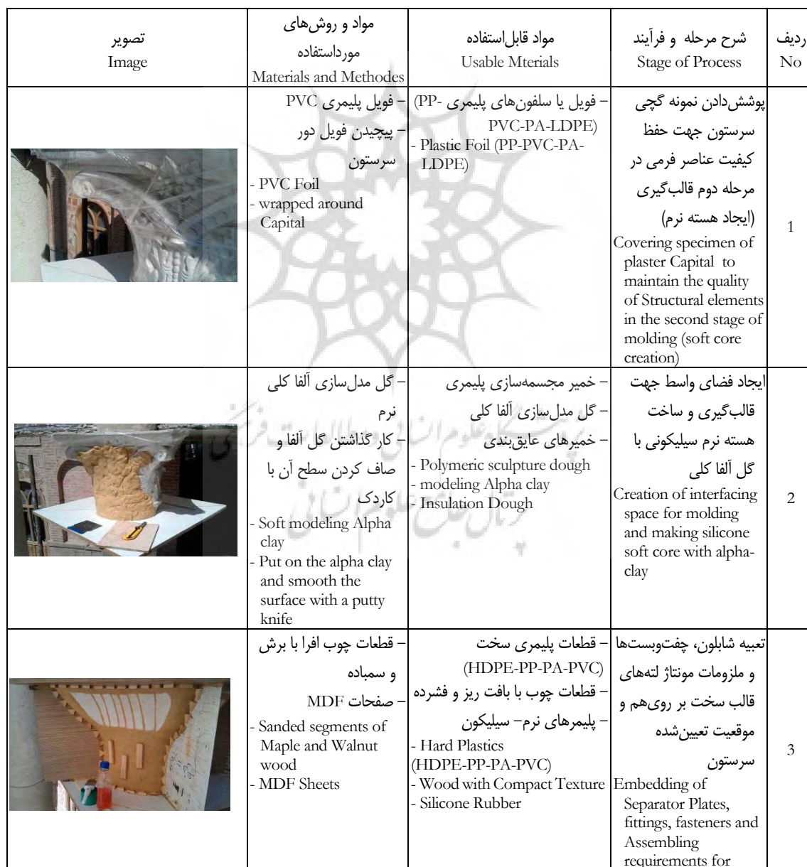
Table 1: Stages of the process of making the Hard-Shell Mold on the selected original Plaster Capital