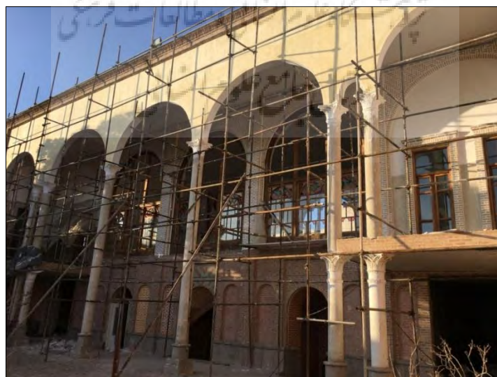
شکل ۴: نصب نمونه‌های قالب‌گیری شده در موقعیت‌های موردنظر Fig. 3: Assembling molded samples in the intend positions

پس از ساخت و تکمیل بخش‌های مختلف قالب، سرستون‌های جدید از طریق قالب‌گیری گچ نمونه‌سازی گردید (شکل ۳) و در موقعیت‌های تعیین شده بر روی ستون‌ها نصب گردید (شکل ۴). نمونه‌های ساخته‌شده از روی قالب نمونه اصلی به دلیل به کارگیری گچ به صورت زنده و سریع در فرآیند قالب‌گیری دارای بافت یکپارچه و