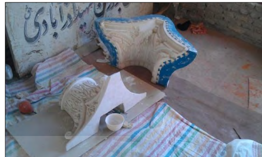
شکل ۳: نمونه‌سازی قطعات جدید با استفاده از قالب دوپوسته Fig. 3: Prototyping of new parts using Hard-Shell Mold

پس از ساخت و تکمیل بخش‌های مختلف قالب، سرستون‌های جدید از طریق قالب‌گیری گچ نمونه‌سازی گردید (شکل ۳) و در موقعیت‌های تعیین شده بر روی ستون‌ها نصب گردید (شکل ۴). نمونه‌های ساخته‌شده از روی قالب نمونه اصلی به دلیل به کارگیری گچ به صورت زنده و سریع در فرآیند قالب‌گیری دارای بافت یکپارچه و