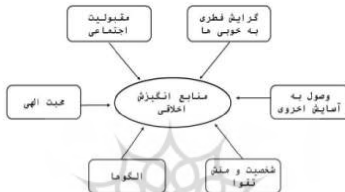
تصویر شماره ۱. منابع انگیزش اخلاقی

المیزان، وجود جامعه صالح را برای تربیت اخلاقی انسان‌ها بسیار مورد تأکید قرار می‌دهد؛ جامعه‌ای که هدف مشترک همه افراد آن، سعادت حقیقی (رسیدن به قرب و منزلت نزد خدا) است (طباطبایی، ۱۳۷۴، ج ۴، ص ۱۵۴) و صلاح و تقوای دینی بر افراد آن غلبه دارد؛ یعنی مردم بر اساس ایمان و عمل صالح عمل می‌کنند ۱ (همان، ج ۵، ص ۲۶۶).