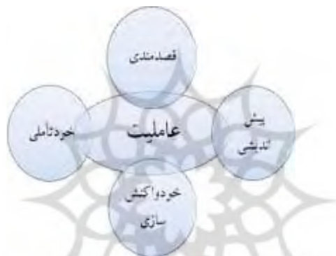
ویژگی‌های چهارگانه عاملیت اخلاقی

بندورا چهار ویژگی اساسی را برای عاملیت برمی‌شمارد: قصدمندی ۱ ، پیش‌اندیشی ۲ ، خودواکنش‌سازی ۳ ، خودتأملی ۴ :