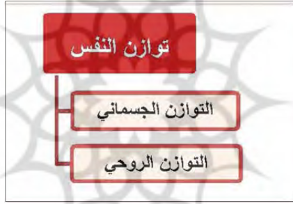
الشكل ١. وجوه مختلف توازن النفس؛ المصدر: الباحث.

الغريون من خلال إغائهم قوّة إدراك الإنسان وكشفه وشهوده، أبعادوا البعد الرمزي عن العالم، وأنكروا أيّ معنى أو تأويل لما وراء الصّورة، فالعمارة الإسلاميّة من وجهة نظرهم تتلخّص في الصّور الهيكلية فحسب، ولم يتناولوا في توصيفهم للعمارة الإسلاميّة إلا السّقف والقوس والزّخرفة والعناصر المكوّنة دون أيّة مراعاة لمعانيها. أما في النّظرة الحكيمية أو المعرفية حيث يبدو الكشف والشّهود القوّة الإدراكية المهمة فيها، فإنّ الصّورة تقتصر على كونها مظهراً وتجلّي لذلك المعنى، وهي تفقد أهمّيّتها مع مرور الوقت، لذا فإنّهم من خلال التأمّل في هذه الصّور يعملون على حلّ الرّموز وكشف المعاني في هذه العمارة، وحينئذ ستتكشف مقولات كثيرة أمامهم أيضاً عبر هذا النّوع من الرّؤية، ومن أهمّ هذه المقولات الفنان ونوع الفكر والرّؤية والنّظرة التي يحملها تجاه العالم.