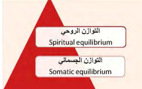
الشكل ٢. مراتب توازن النفس؛ المصدر: الباحث.

و يقول: «إنّ الإنسان في نظير الإسلام ليس شقين منفصلين: شقاً أرضياً يعمل وشقاً سماوياً يتعبّد. إنّما العبادة عمل والعمل عبادة. والإنسان بشقيّه شيء واحد، وملاك الأمر في هذه الشؤون كلّها هو «التوازن». وهو صفة تكتسبها النفس من السير عليّ منهج الله» (التسخيري، ١٩٨١). أمّا التوازن في الإنسان فينتجلى في المراتب الظاهرة والباطنة، وثمة أحكام كثيرة أيضاً حول إيصال النفس إلى حالة التوازن التي تمّ الإشارة إليها تزامناً مع هذين الوجهين للنفس.