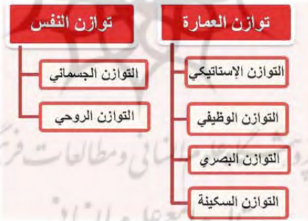
الشكل ٣. مراتب توازن النفس و توازن العمارة؛ المصدر: الباحث.

و يقول: «إنّ الإنسان في نظير الإسلام ليس شقين منفصلين: شقاً أرضياً يعمل وشقاً سماوياً يتعبّد. إنّما العبادة عمل والعمل عبادة. والإنسان بشقيّه شيء واحد، وملاك الأمر في هذه الشؤون كلّها هو «التوازن». وهو صفة تكتسبها النفس من السير عليّ منهج الله» (التسخيري، ١٩٨١). أمّا التوازن في الإنسان فينتجلى في المراتب الظاهرة والباطنة، وثمة أحكام كثيرة أيضاً حول إيصال النفس إلى حالة التوازن التي تمّ الإشارة إليها تزامناً مع هذين الوجهين للنفس.