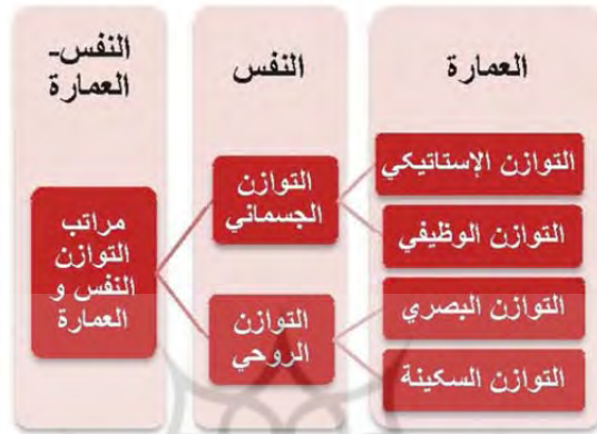
الشكل ٤. التناظر بين توازن العمارة وتوازن النفس؛ المصدر: الباحث.

نظروا إلى باطن الدنيا إذا نظر النَّاس إلى ظاهرها» (صَحح البلاغ: ٤٣٢). والأفراد بحسب موقعهم من فهم الحقيقة والدرجة التي يبلغونها فيها، غالباً ما يستطيعون إدراك مستويات متفاوتة من الحقائق والمعاني وإبرازها مجدداً في مظاهر عالم التشريع.