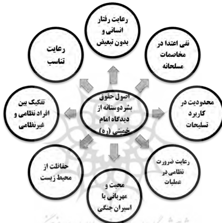
شکل ۲. اصول حقوق بشردوستانه از دیدگاه امام خمینی (ره)

شایان یادآوری است که واژه حقوق بشردوستانه به طور خاص در بیانات امام خمینی (ره) استفاده نشده است، اما بسیاری از اصول و قواعد آن مورد اشاره ایشان بود که می‌توان در شکل ۲ خلاصه کرد.