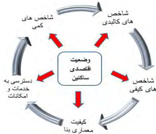
شکل ۱: مدل مفهومی پژوهش