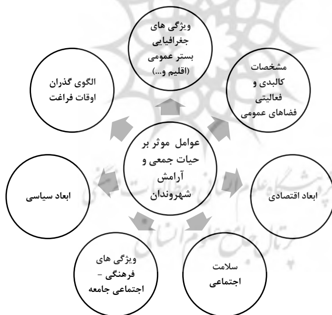
نمودار ۳- عوامل موثر بر حیات جمعی و آرامش شهروندان (نگارنده)

هویت شهری مفهومی است که در فرآیند ادراک سهل و دشوار است. در این باب می توان گفت که شهرها و اجزا و عناصر آنها ابزارهای فرهنگی موثری هستند که با نوعی سازگاری اجتماعی بی صدا، رفتار خود و جامعه را تشکیل می دهند، در این حالت فضایی خلق می شود که افراد جامعه بتوانند به نحو مطلوب هنجار و رفتارهای خود را در آن سامان دهند. حال چه بهتر که این ابزارها براساس عوامل بصری و زیباشناختی محیط شکل گیرند، زیرا به گفته گوردن کالن، همان طور که هنری به نام معماری وجود دارد، چیزی هم به نام هنر ارتباط معنی وجود دارد که موضوع آن ترکیبی است از کلیه عناصر سازنده محیط مانند، بناها، درختان، طبیعت، تبلیغات و تابلوها، ترافیک و جز اینها در شهر شخصیت شهرها با مولفه های متفاوتی تعریف و