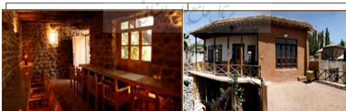
عکس شماره (۱) نمایی از کاشانه رسولی در روستای گازرخان

امروزه پایگاه میراث فرهنگی استان و سایر نهادها در جهت توسعه گردشگری گازرخان به عنوان یکی از روستاهای هدف گردشگری، طرحها و برنامه های متعددی از منظر مرمت و تاسیس نهاده های مختلف به انجام رسانده و در حال انجام آن هستند. یکی از طرح های صورت گرفته در این روستا، طرح احداث کاشانه ها و خانه های روستایی می باشد که عموماً از سال ۱۳۸۹ آغاز گردید. با راه اندازی اولین خانه روستایی در روستای گازرخان الموت افراد زیادی برای اجرای طرح کاشانه های روستایی متقاضی شده و با اختصاص قسمتی از منزل روستایی خود به مرکز اقامتی برای گردشگران اعلام آمادگی کرده اند (روزنامه ایران، ۱۳۸۹: ۲۳). از نمونه این کاشانه ها، کاشانه رسولی می باشد. در کاشانه رسولی با معماری سنتی و محیطی دلنشین و خاطره انگیز واقع در میدان روستای گازرخان الموت پس از بازسازی، مرمت و تجهیز با امکانات رفاهی، زیر نظر و با همکاری پایگاه میراث فرهنگی الموت، مورد بهره برداری قرار گرفت. امکانات کاشانه رسولی شامل ۲ واحد اطاق خواب و پذیرائی، حمام، و سرویسهای بهداشتی زنانه و مردانه، غذاخوری سنتی، نان پزی سنتی، کباب پزی در حیاط، آشپزخانه مجهز می باشد (مطالعات میدانی، ۱۳۹۳).