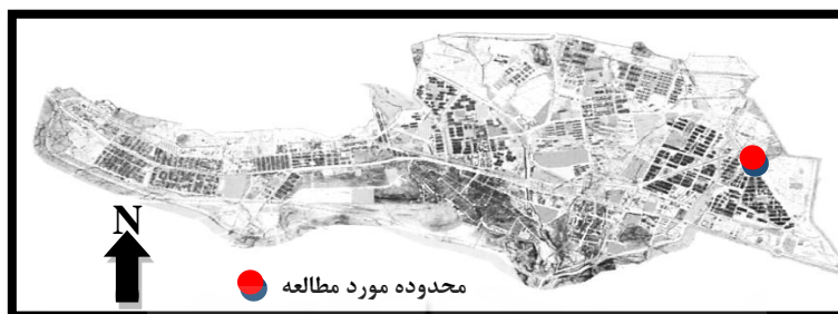
شکل ۲- موقعیت قرارگیری مجتمع مسکونی (محدوده مطالعه) در شهر دوگنبدان، (مآخذ: نگارندگان، ۱۳۹۶)