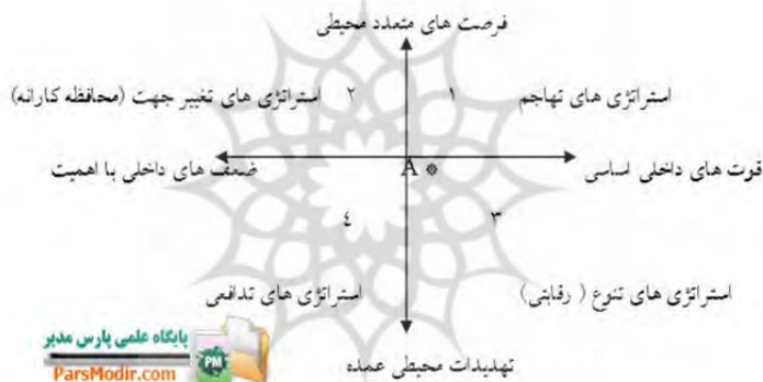
شکل شماره ۲: الگوی ارزیابی و انتخاب استراتژی

برای تجزیه و تحلیل هم زمان عوامل داخلی و خارجی از ماتریس داخلی و خارجی استفاده می‌گردد. این ماتریس برای تعیین موقعیت صنعت یا سازمان به کار می‌رود و برای تشکیل آن باید نمرات حاصل از ماتریس ارزیابی عوامل داخلی و ماتریس ارزیابی عوامل خارجی را در ابعاد عمودی و افقی آن قرار داد تا جایگاه صنعت یا سازمان در بازار مشخص گردد و بتوان استراتژی‌های مناسبی را برای آن مشخص کرد. این ماتریس منطبق بر ماتریس SWOT است و استراتژی‌های مناسب برای سازمان را مشخص می‌کند.