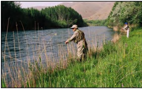
جاذبه‌های طبیعی استان