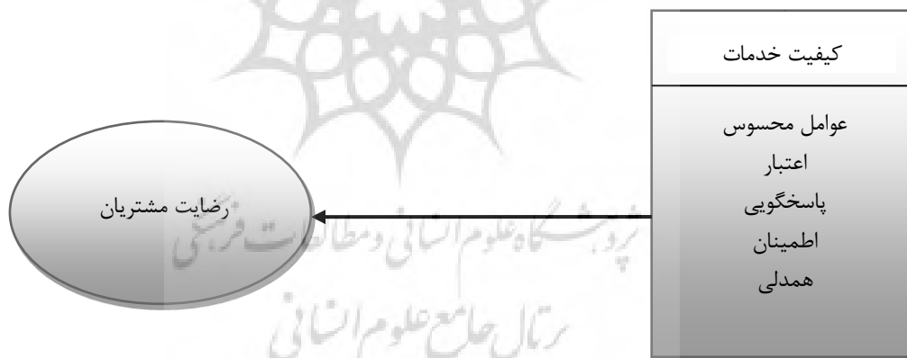
نمودار ۱- مدل مفهومی پژوهش (رحمان و همکاران، ۲۰۱۱)