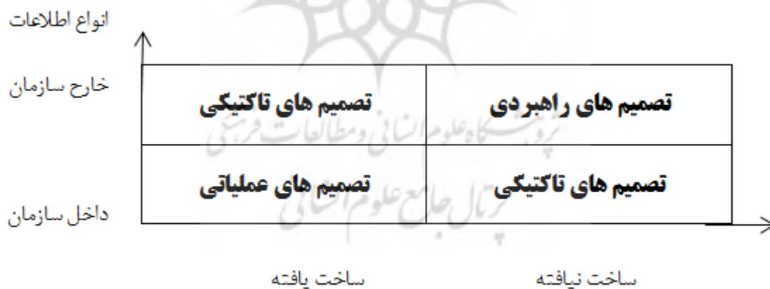
شکل (۲): ماتریس تصمیم گیری سازمانی (مدیریت توسعه سیستم ها و فناوری اطلاعات، سازمان گسترش و نوسازی صنایع ایران، ۱۳۸۴)

۳. تصمیمات تاکتیکی: این تصمیمات مربوط به وظایف برنامه ریزی و کنترل تاکتیکی سازمان می باشد. بخش عمده ای از اطلاعات ورودی به این سطح، خلاصه عملکرد فعالیتهای اصلی سازمان است که غالباً نیز ادواری می باشند. در این موارد، اطلاعات ورودی کاملاً ساختاری بوده و از نظر محتوا قابل پیش بینی، دقیق و صحیح می باشند (صرافی زاده، علی پناهی، ۱۳۸۰: ص ۷۹)