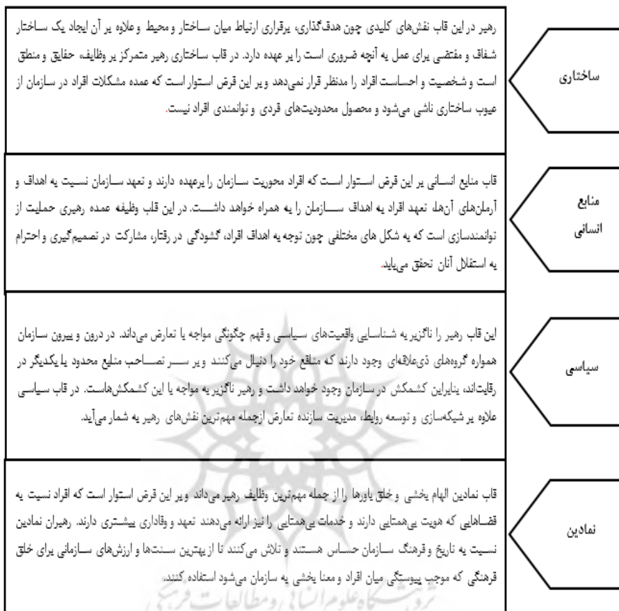
شکل ۱. الگوی چهار قاب رهبری (Bolman & Deal, 2013; 2008; 2003; 1991)

جامعیت الگوی چهار قاب رهبری موجب شده است تا پژوهش‌های متعددی این الگو را مبنای مطالعه مقوله رهبری در مؤسسات آموزش عالی قرار دهند. برای مثال بنسیمون (Bensimon, 1990) و تامپسون (Thompson, 2000) با بررسی عملکرد رهبران دانشگاهی دریافتند آن دسته از رهبرانی که بیش از سه بعد الگوی رهبری بولمن و دیل (۱۹۹۱) را مدنظر قرار می‌دهند در مقایسه با رهبرانی که بر یک یا دو بعد متمرکز هستند عملکرد بهتری را از خود نشان داده‌اند. ساسنت و راس (Sasnett & Ross, 2007) نیز ادراک مدیران برنامه‌های آموزش پزشکی در خصوص چهار قاب رهبری را مورد مطالعه قرار