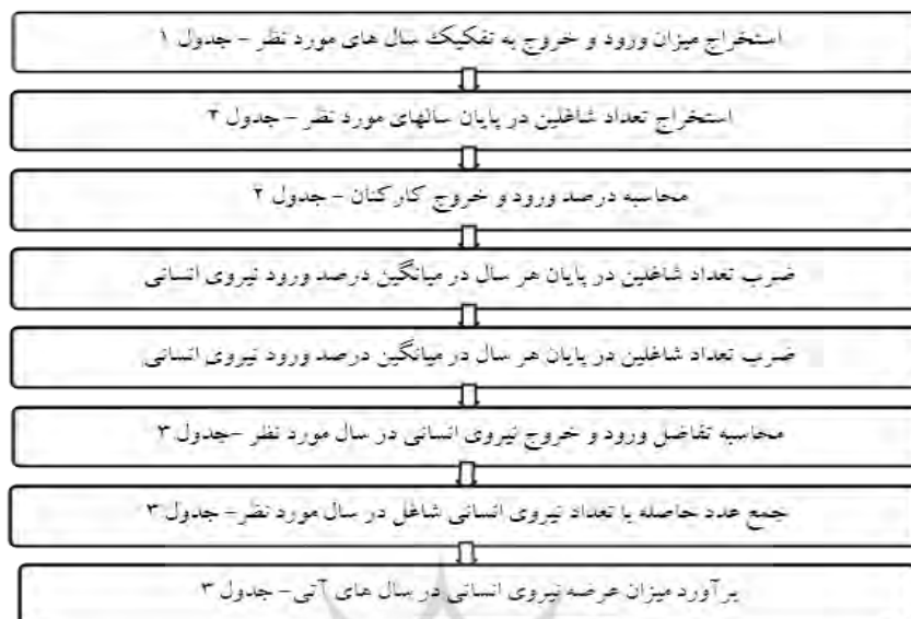
شکل ۲. فرایند انجام محاسبات