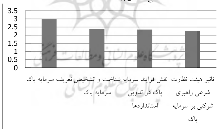
نمودار (۲): رتبه‌بندی عوامل - آزمون فریدمن