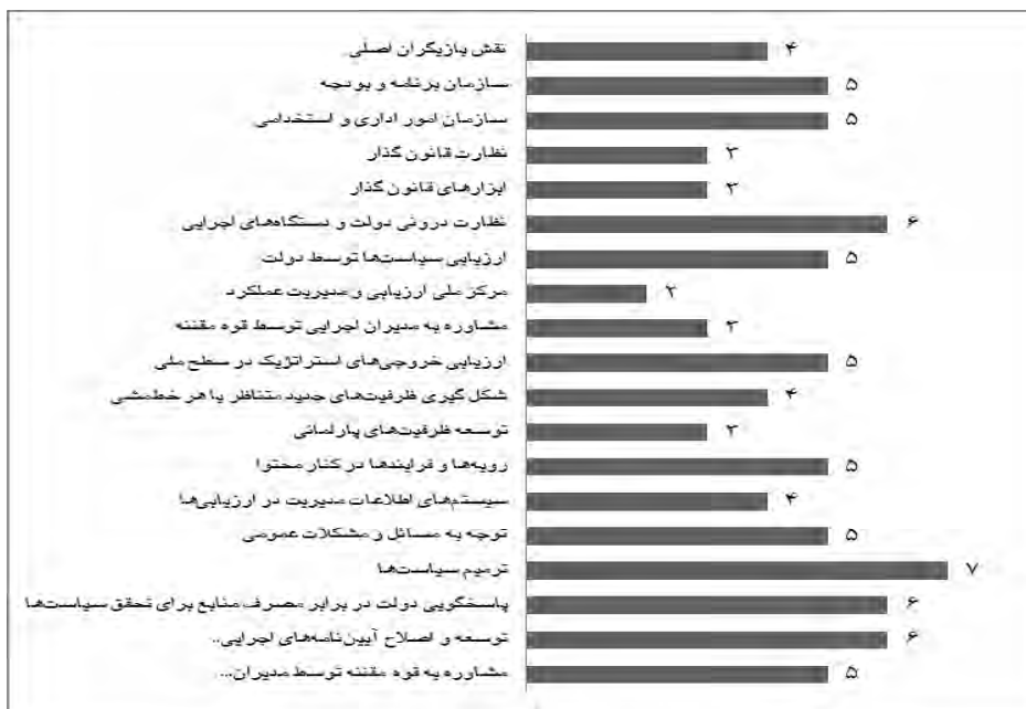
نمودار ۱. فراوانی رویکردها نسبت به مدیریت عملکرد در سطح دولت