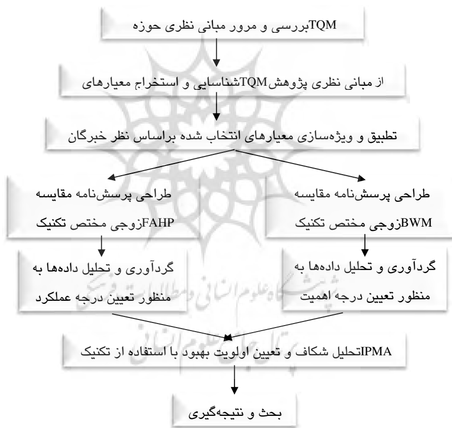
شکل ۲ مراحل کلی اجرای پژوهش

مراحل اجرای پژوهش با توجه به روش‌های تجزیه و تحلیل بیان شده به طور خلاصه مطابق شکل ۲ نشان داده شده است.