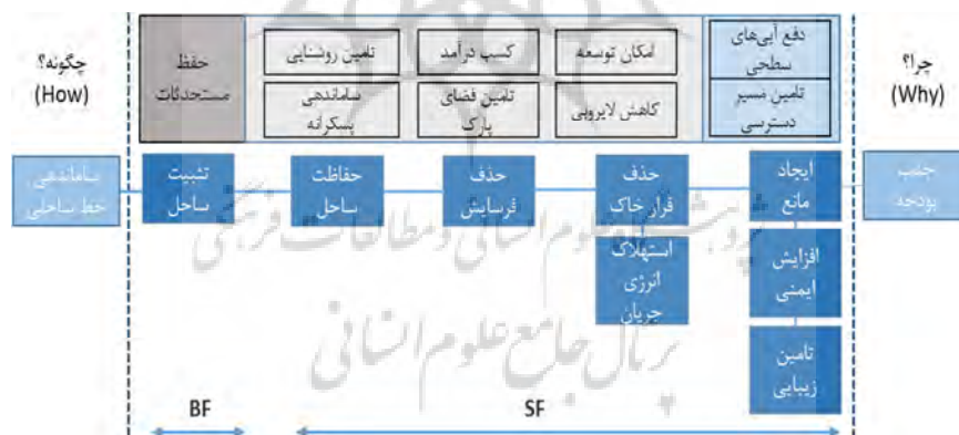
شکل ۲ نمودار فن تحلیل کارکرد سیستم