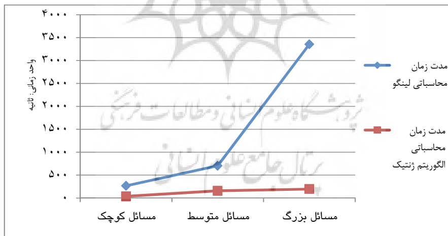
نمودار ۱ رابطه نوع مسأله و مدت زمان محاسباتی در نرم‌افزار لینگو و الگوریتم ژنتیک

برای حل مسأله به منظور بررسی عملکرد الگوریتم ژنتیک از نرم‌افزار لینگو استفاده شد و نتایج مورد مقایسه قرار گرفت. نتایج آزمایش‌ها در جدول ۴ نشان داده شده است. برای هر نوع مسأله یک بیشینه زمانی پردازش برای روش‌های حل در نظر گرفته شد. برای حل مسأله الگوریتم ژنتیک چندین بار اجرا و بهترین پاسخ و نتایج ثبت شد. ابعاد زمان محاسباتی و مقدار تابع هدف نسبت به پاسخ‌های نرم‌افزار لینگو برای ارزیابی عملکرد الگوریتم ژنتیک مقایسه شد. رابطه نوع مسأله و مدت زمان محاسباتی در نمودار ۱ به منظور بررسی پیچیدگی مسأله نشان داده شده است.