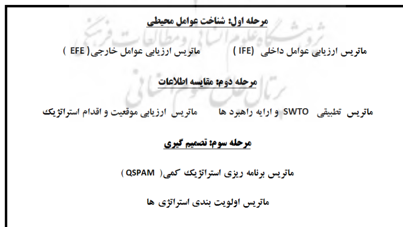
شکل (۱). روش شناسی و چهارچوب تحلیلی برنامه ریزی استراتژیک

این پژوهش با استفاده از روش شناسی توصیفی و تحلیلی و از طریق مطالعات اسنادی و میدانی انجام پذیرفته است. همچنین در پژوهش حاضر روش جمع آوری اطلاعات اسنادی بصورت مراجعه و فیش برداری از مدارک و اسناد کتابخانه‌ای و همچنین در مطالعات میدانی از روش نمونه برداری (روش کوکران)، مشاهده مستقیم، مصاحبه، تهیه عکس، فیلم و برای تجزیه و تحلیل اطلاعات از تکنیک استراتژیک SWOT و نرم افزارهای SPSS و EXCEL استفاده شده است. جامعه آماری مورد مطالعه در این مقاله را خبرگان و مسئولان دستگاهها و نهادهای مرتبط با گردشگری شهری تشکیل می دهند که تعداد ۷۰ نفر بعنوان نمونه انتخاب شده است. سپس باتوجه به تحلیل عوامل چهارگانه قوت، ضعف، تهدیدات و فرصت ها، پرسشنامه ای حاوی ۲۰ پرسش پنج گزینه ای به دست آمد در این بخش برای تکمیل پرسشنامه ها از ۷۰ نفر از خبرگان و مسئولان دستگاهها و نهادهای مرتبط با گردشگری شهر مورد مطالعه کسب نظر انجام شد. پرسش ها بر اساس طیف لیکرت شامل ۵ گزینه خیلی زیاد - زیاد - متوسط - کم و خیلی کم بود. جهت تجزیه و تحلیل اطلاعات و ارائه الگوی راهبردی توسعه توریسم شهری از روش تحلیلی SWOT استفاده شده است که در ابتدا با سنجش محیط داخلی و محیط خارجی شهر فهرستی از نقاط قوت، ضعف، فرصتها و تهدیدات مورد شناسایی قرار گرفت و سپس بوسیله نظر خواهی از خبرگان و مسئولان امر و وزن دهی به هرکدام از این مسائل و سپس محاسبه و تحلیل آنها، اولویت ها مشخص شد و جهت برطرف نمودن یا تقلیل نقاط ضعف و تهدیدها و تقویت و بهبود نقاط قوت و فرصتهای موجود در ارتباط با گسترش گردشگری شهری در شهر شهرکرد، در نهایت استراتژی های مناسبی ارائه شده است. مراحل شناسایی، ارزیابی و وزن دهی به عوامل چهارگانه در تحلیل SWOT عبارتند از شکل (۱):