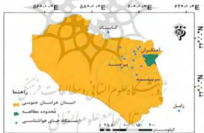
شکل ۲: موقعیت ایستگاه‌های هواشناسی محدوده مطالعه

با استفاده از داده‌های بارش روزانه ۱۵ ایستگاه هواشناسی در اطراف محدوده مطالعه (شکل ۲)، بارندگی سالانه در طول دوره سی ساله (۱۹۸۶-۲۰۱۵ میلادی) استخراج گردید سپس این داده‌ها برای محدوده مطالعه به روش IDW در نرم‌افزار ArcGIS میانمایی و با استفاده از شاخص استاندارد بارش (SPI ۲ ) سال‌های خشک، تر و نرمال مشخص شدند. برای تکمیل سال‌های فاقد داده بارندگی هریستگاه از روابط همبستگی با ایستگاه‌های مجاور و نرم‌افزار SPSS استفاده شد.