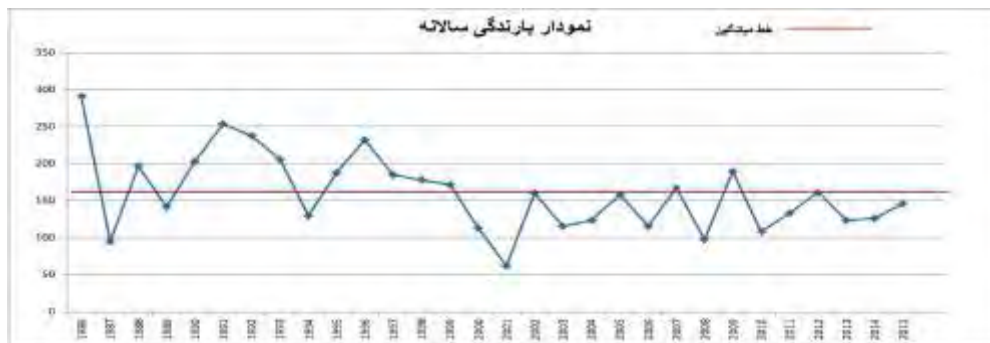
شکل ۴: تفکیک دو دوره مرطوب و خشک در بررسی سی ساله

شکل ۵، طبقات بارش سالانه در سری زمانی سی ساله محدوده مطالعه را بر اساس شاخص استاندارد بارش (SPI) نشان می‌دهد. ترسالی و خشکسالی با شدت‌های مختلف همچنین تغییرات بارندگی سالانه در سال‌های نرمال رخدادهایی هستند که در این نمودار ارائه گردیده‌اند.