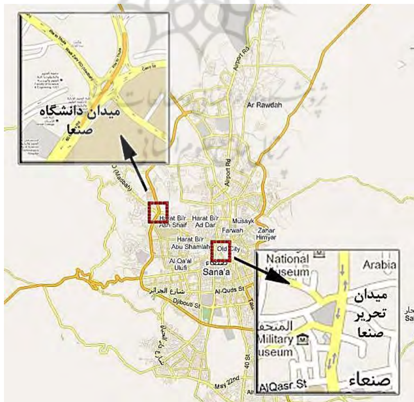
تصویر ۴. موقعیت میدان تحریر در بخش مرکزی شهر قاهره

با سرکوب ناآرامی‌های میدان تحریر، حرکت‌های اعتراضی در مرحله اول به سطح خیابان‌های اصلی بخش مرکزی شهر سپس به حاشیه غربی صنعا در مجاورت شمال غربی دانشگاه اصلی این شهر انتقال یافت (تصویر ۴ و جدول ۴).