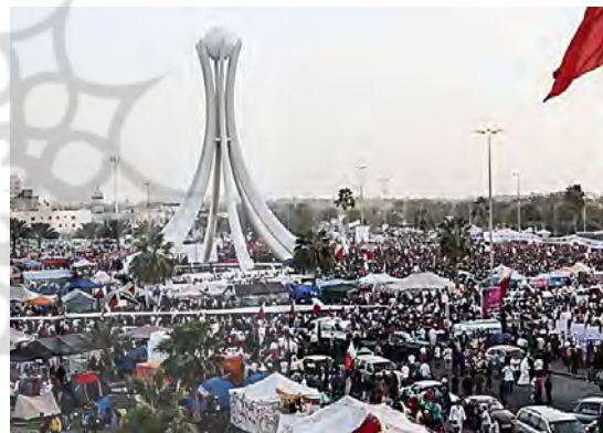
تصویر ۶. میدان مروارید منامه در جریان اعتراضات سال ۲۰۱۱ و تغییرات پس از آن ( http://en.wikipedia.org )