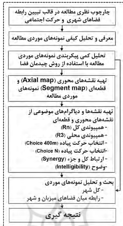
تصویر ۱. فرایند مطالعه