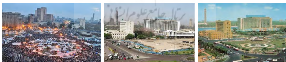
تصویر ۳. سیر تحول میدان تحریر در اوایل سال‌های ۱۹۶۰، در دوره زمامداری حسنی مبارک و در ششم فوریه سال ۲۰۱۱ (الشاهد، ۲۰۱۱)

میدان تحریر در جریان حرکت‌های اجتماعی مردم قاهره به کانون اصلی تجمع و اعتراضات گروه‌های مختلف تبدیل شد. پس از اقدام نظامی علیه محمد مرسی و به دست گرفتن قدرت از سوی ژنرال السیسی، میان نیروهای مردمی طرفدار این دو جریان شکاف ایجاد شد و با به تصرف درآمدن میدان تحریر توسط طرفداران حکومت السیسی، نیروهای طرفدار حکومت محمد مرسی به فضای شهری میدان رابعه عدویه در حاشیه شرقی شهر قاهره در مجاورت مرکز آموزش دینی الازهر رانده شدند. در جدول ۳ به ویژگی‌های اصلی میدان تحریر و رابعه عدویه قاهره اشاره شده است.