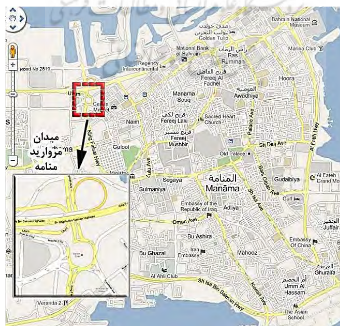
تصویر ۵. موقعیت میدان مروارید در شمال غرب شهر منامه ( http://maps.google.com )

در سال ۲۰۱۱، اعتراض بحرینی‌ها با شعار انجام اصلاحات برای برابری حقوق قانونی و سیاسی و محافظت در برابر بیکاری آغاز شد، اما با گذشت زمان و در پی اعمال فشار حکومت بحرین، معترضان مواضع سخت‌تری در پیش گرفتند و خواهان برکناری هیئت حاکم شدند. آن‌ها فلکه مروارید (لؤلؤ) در شمال غرب منامه را به عنوان یکی از مهم‌ترین گره‌های دسترسی به مرکز شهر، فروشگاه‌های زنجیره‌ای، بندرگاه منامه و محلات مسکونی شیعه‌نشین به عنوان مکان اعتراض انتخاب کردند (تصویر ۵ و جدول ۵).