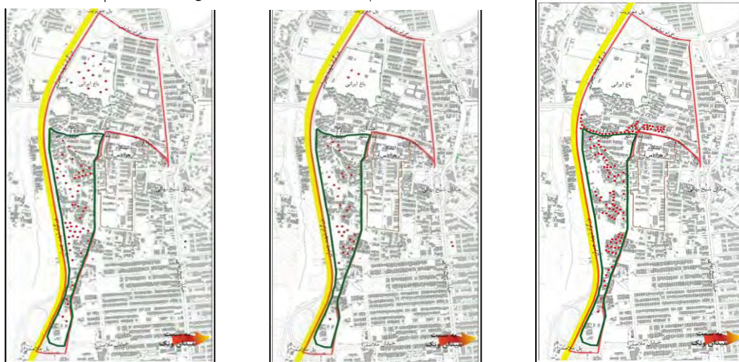
شکل ۱- مکان انجام فعالیت‌های ضروری شکل ۲- مکان انجام فعالیت‌های انتخابی شکل ۳- مکان انجام فعالیت‌های اجتماعی