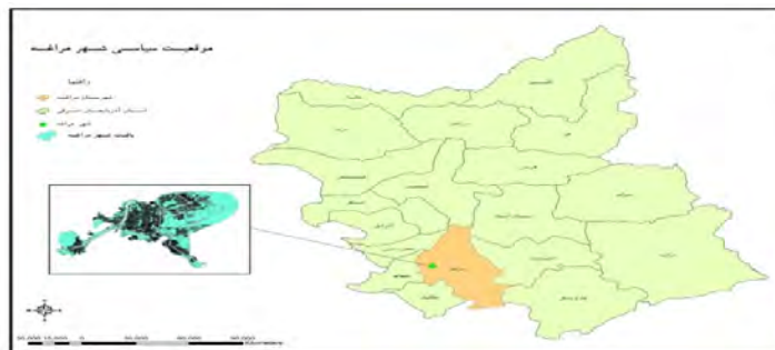
شکل ۱- موقعیت سیاسی شهر مراغه