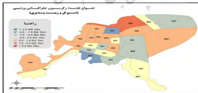
شکل ۳- لایه خروجی تحلیل رگرسیون وزنی جغرافیایی باقیمانده استاندارد شده تمام شاخص ها

برای تحلیل اثرات شاخص های پراکنده رویی بر زیست پذیری محلات نقشه میزان ضریب مثبت و منفی شاخص های پراکنده رویی بر زیست پذیری محلات آورده شده است. البته این خروجی یک مشکل اساسی دارد این است که ضریب هر یک از شاخص ها معلوم نیست که در ادامه به صورت جداگانه تأثیر هر یک از شاخص آورده می شود. همچنین با توجه به ماهیت شاخص های پراکنده