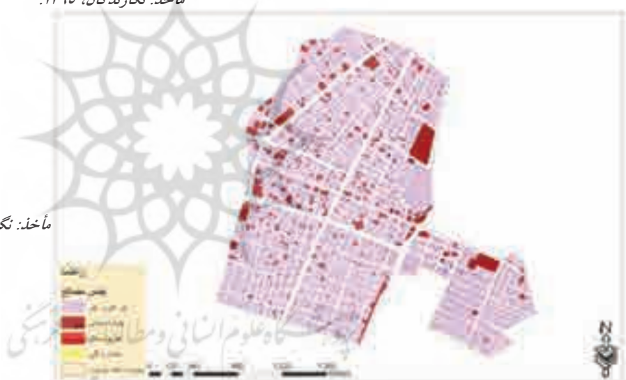
نگاره ۴: تعداد طبقات