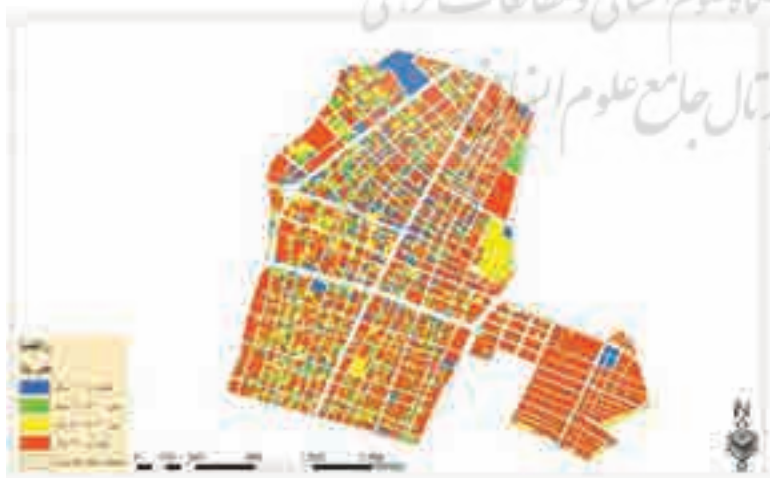
نگاره ۵: عمر بنا

تعداد طبقات: وجود تعداد طبقات بالا در هنگام بحران اگر با فاکتورهایی همانند جنس مصالح ناپایدار و اسکلت نامقاوم همراه باشد میزان تلفات و خسارات در هنگام بحران را