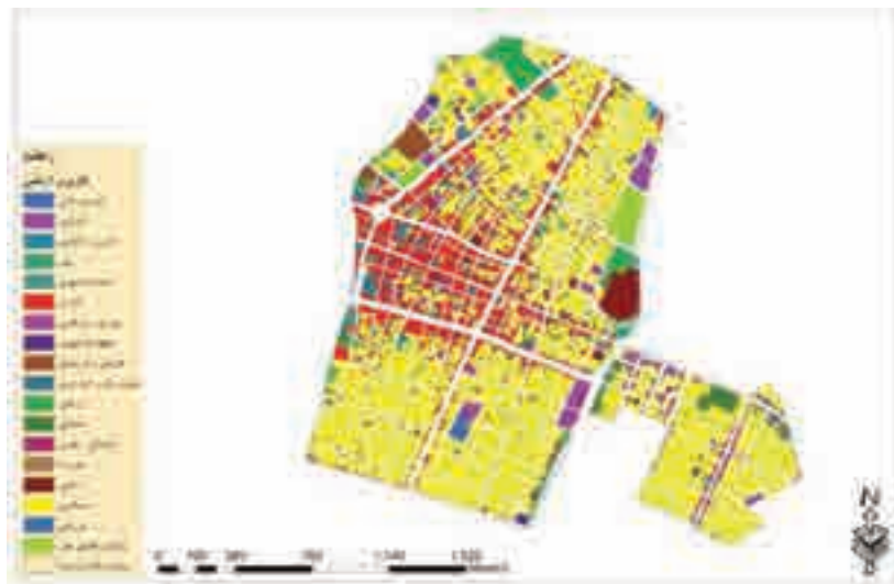
نگاره ۱: وضعیت استفاده از کاربری اراضی محدوده مورد مطالعه