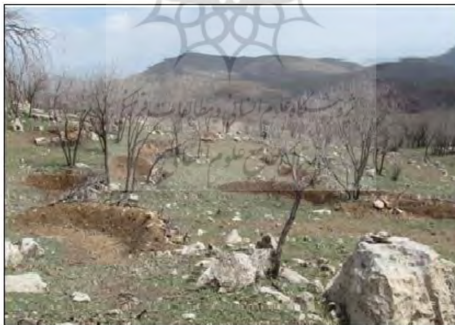
شکل ۲. ابعاد و فاصله بانکت‌های هلالی ذخیره رواناب سطحی در پلات‌های جنگل بلوط